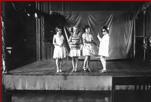
Theateraufführung von Schülerinnen der 121. Volksschule in der Aula, um 1931

Zu den ersten Maßnahmen nach der Errichtung der nationalsozialistischen Diktatur im Januar 1933 gehörte die Säuberung der Lehrerschaft von Juden und politischen Gegnern. In den Unterricht und die Lehrbücher fanden zunehmend die rassistischen und militaristischen Inhalte der NS-Ideologie Eingang. Unübersehbar wuchs in Gesellschaft und Schule die Diskriminierung und Ausgrenzung jüdischer Kinder.