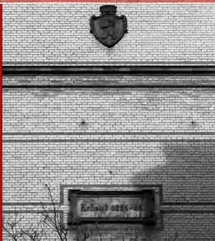
Teil der Fassade an der Mülhauser Straße