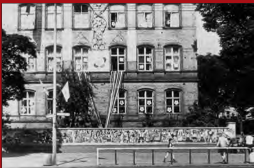
Das Schulgebäude dekoriert zu den X. Weltfestspielen der Jugend und Studenten 1973 in Ost-Berlin

Die vormilitärische Erziehung und gezielte Nachwuchsgewinnung für Armee und Sicherheitsorgane an den Schulen verstärkte seit Mitte der 80er Jahre die Kritik am Schulwesen der DDR.