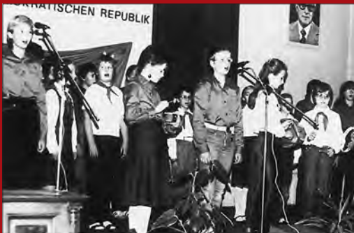
Feier in der Aula der Schule, 1985