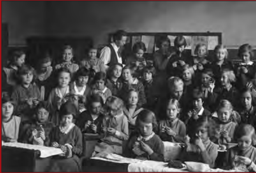
Während des Handarbeitsunterrichts an der Mädchenschule, um 1931

den Dienst der Kriegsvorbereitung gestellt. 1938 wurde aus der 105. Volksschule (Knaben) die 13. Volksschule (Knaben) und aus der 121. Volksschule (Mädchen) die 14. Volksschule (Mädchen) des Verwaltungsbezirks Prenzlauer Berg. Mit Zunahme der Luftangriffe auf Berlin wurden seit Ende 1943 ganze Schulen in Lager der »Kinderlandverschickung« (KLV) verlegt.