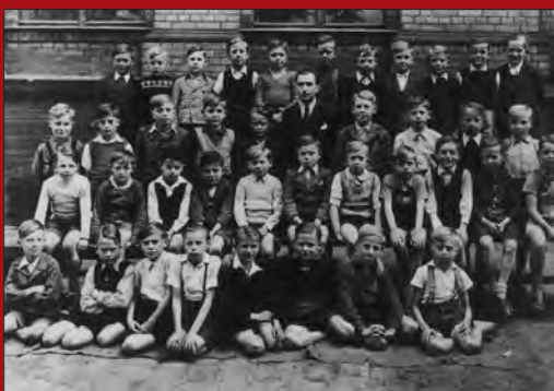
Klasse 4a der 13. Volksschule, 1947

Nach Kriegsende 1945 gehörte die Schule an der Prenzlauer Allee zu den wenigen Schulgebäuden im Bezirk, die den Krieg weitgehend unbeschadet überstanden hatten. Bereits Ende Mai 1945 konnten die beiden Volksschulen den Unterricht wieder aufnehmen. Im August 1947 wurden die 13. Volksschule für Knaben und die 14. Volksschule für Mädchen wegen Überfüllung geteilt. Es mangelte an Lehrern und an Unterrichtsräumen. In den Abendstunden war das Schulhaus Unterrichtsstätte für die im Herbst 1945 eröffnete Volkshochschule und die 1947 gebildete Volksmusikschule Prenzlauer Berg. Zu den Lehrern, die in jenen Jahren in diesem Schulhaus unterrichteten, gehörte der nicht nur in der Berliner Lehrerschaft bekannte Heimatkundler Wilhelm Ratthey. Wesentlich auf seine Initiative wurden Ende 1945/Anfang 1946 an allen Schulen in Prenzlauer Berg Aufsätze geschrieben, in denen die Kinder ihre Erlebnisse in den letzten Kriegstagen und den beginnenden Wiederaufbau schilderten.