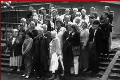
Im Mai 2003 besuchten ehemalige Schulleiter, Lehrerinnen und Lehrer, Horterzieherinnen und Sekretärinnen, ihre ehemalige Wirkungsstätte.

Die Angebote von Bibliothek, Volkshochschule und Museum sind geeignet, sich inhaltlich zu ergänzen. Das Gebäude mit seinen Unterrichtsräumen, Lesebereichen und Ausstellungsflächen, seinen Bibliotheks- und Archivbeständen versteht sich über die Nutzer und Besucher der drei Einrichtungen hinaus als ein Treffpunkt und Ort gemeinsamen Lernens – ein lebendiges Bildungszentrum am Wasserturm.