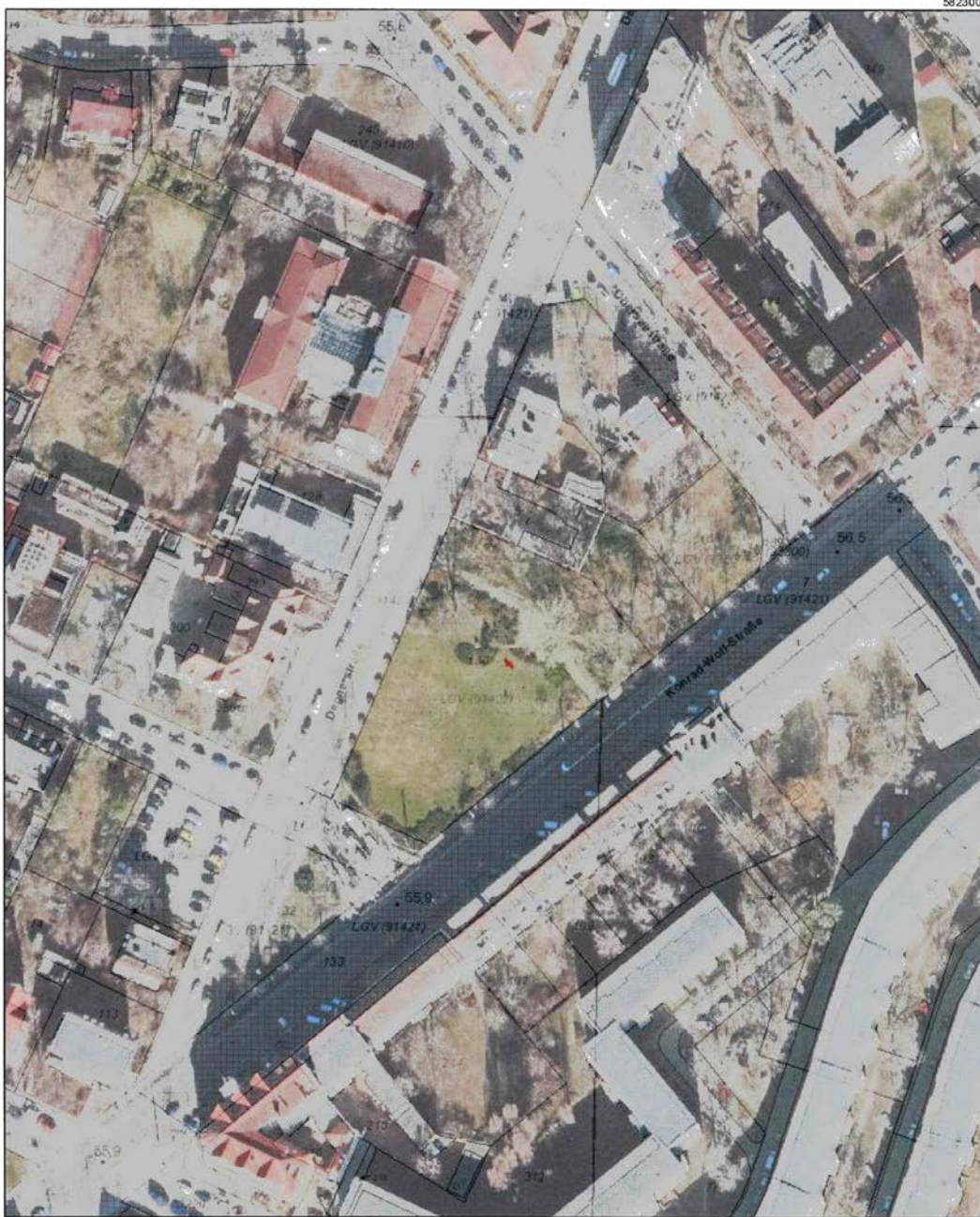
Maßstab: 1:1500 Meter