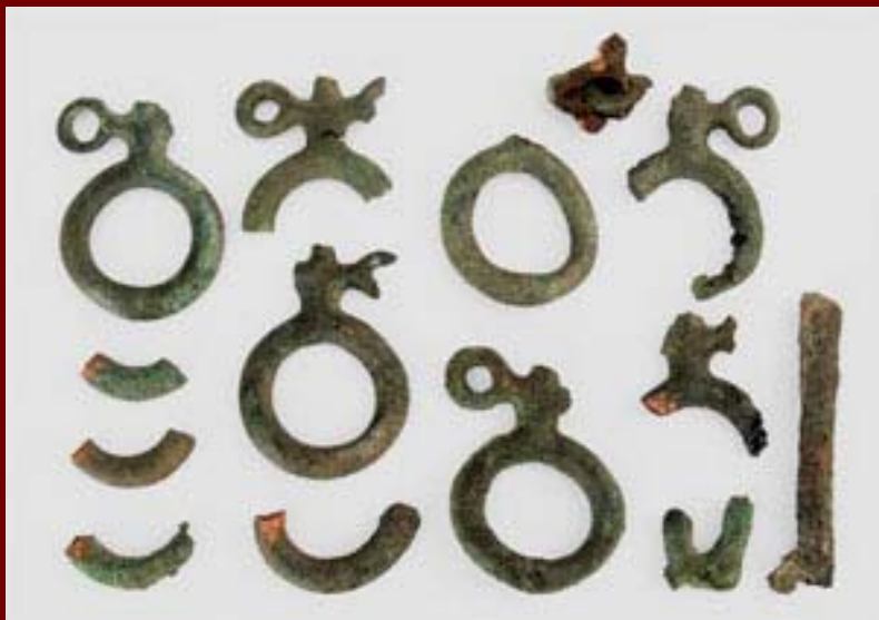
Funde Hultschiner Damm 1928