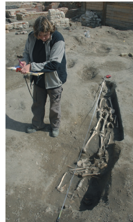
Grabung Petriplatz

18.00 Uhr Eröffnung der Sonderausstellung „Archäologische Handzeichnungen in Berlin“ Ort: Palais am Festungsgraben