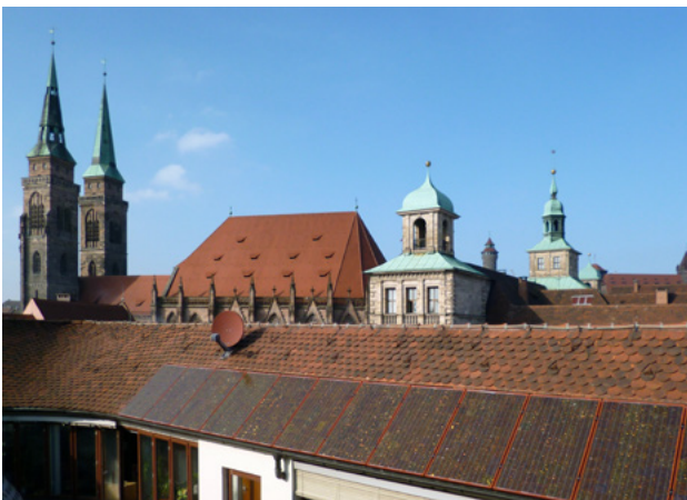
Abb. 13: An Dachdeckung farblich angepasste Module