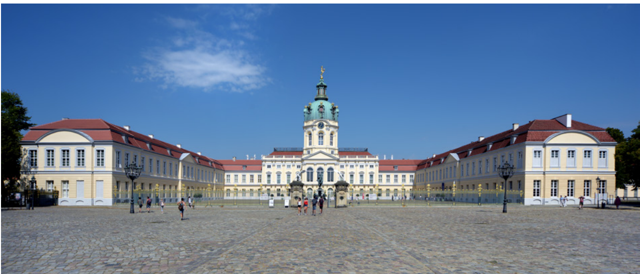
Abb. 17: Dachflächen der weithin sichtbaren Schlossanlage Charlottenburg