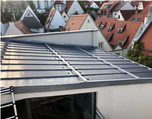
Abb. 10: Durch ein Glasfaserträgermaterial sind die Module auf diesem Metalldach besonders dünn und leicht