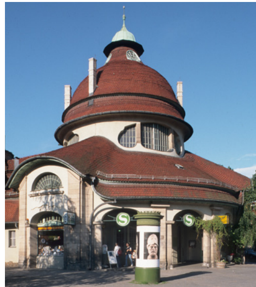
Abb. 18: Aufwändig ausgebildetes Dach des S-Bahnhofs Mexikoplatz

Denkmale mit besonders gestalteter Dachform, besonderer Dachdeckung oder Dachkonstruktion bieten keine denkmalverträglichen Flächen für Solaranlagen. Hierzu zählen unter anderem Gebäude, deren Dächer besonders raumbildend sind und skulptural wirken. Auch Dächer mit üppigen Gestaltungen, z. B. durch Gauben, Laternen und Dachreiter oder mit seltenen Deckungsmaterialien wie Spließdeckungen oder Handstrichziegeln sind kritisch zu sehen.