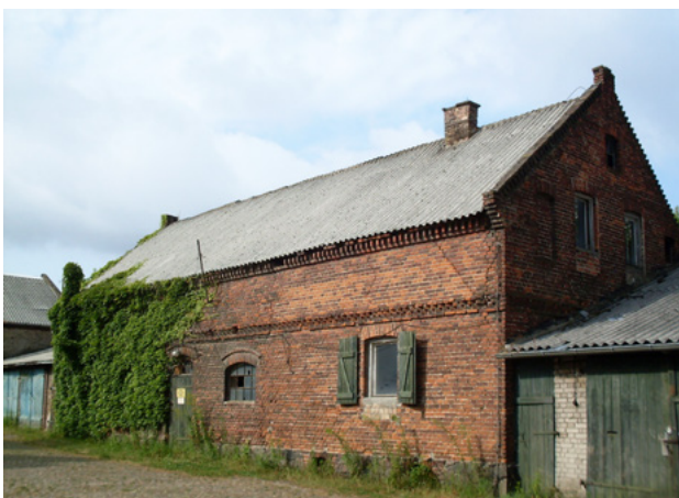
Abb. 9: Denkmalgeschütztes Wirtschaftsgebäude