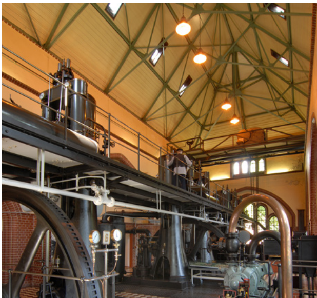
Abb. 19: Filigranes Dachtragwerk