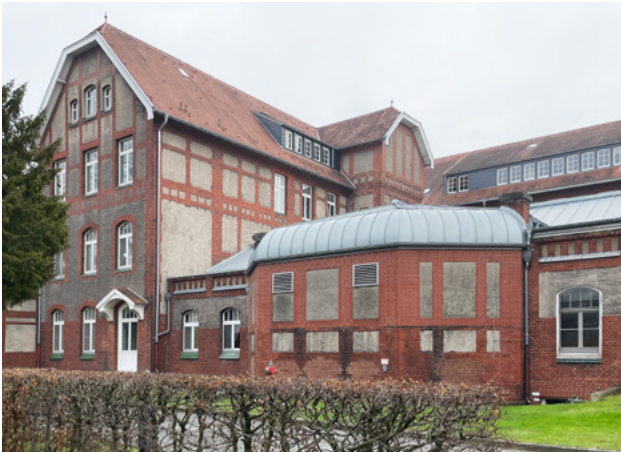
Abb. 4: Die Dachfläche ist nur vom halböffentlichen Bereich aus zu sehen