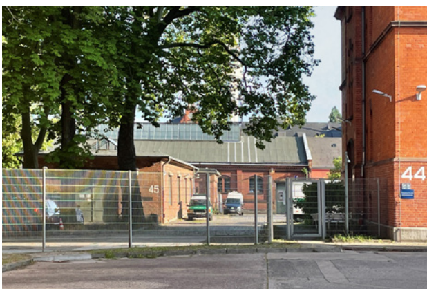
Abb. 3: Die Dachflächen der Hofgebäude in der Jüterboger Straße sind nur teilweise einsehbar