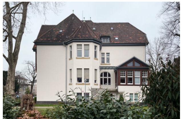
Abb. 2: Die Dachfläche ist nur von einem privaten Garten aus einsehbar

„Öffentlicher Raum“ sind öffentlich gewidmete Verkehrs- oder Grünflächen.