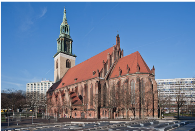
Abb. 15: Städtebaulich stark prägendes Dach der Marienkirche in Mitte

Bauzeitlich erhaltene Dächer ohne nachträgliche Veränderungen, die aus dem öffentlichen Raum gut sichtbar sind, haben in der Regel eine besondere städtebauliche Bedeutung. Das Aufbringen einer Solaranlage ist daher nur in Sonderfällen und nach ausführlicher Einzelfallprüfung möglich. Dies gilt besonders für repräsentative Dachflächen und Sonderbauten wie Schlösser oder Sakralbauten.