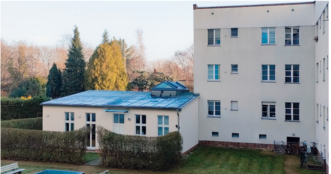
Abb. 12: Das Dach eines denkmalgeschützten Nebengebäudes ist aus dem halböffentlichen Raum einsehbar. Die Sichtbarkeit konnte durch eine PV-Anlage mit flachen Modulen reduziert werden