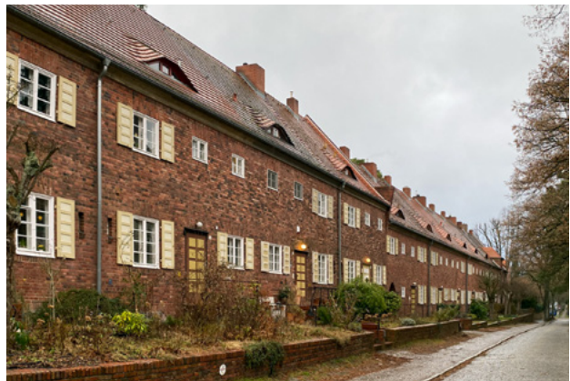
Abb. 16: Städtebaulich prägende Dachlandschaft einer Siedlung