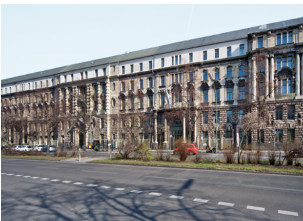
Abb. 6: Denkmal mit überformtem, nicht bauzeitlichem Dach