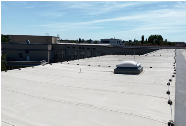
Abb. 1: Flachdach der Hochschule für Technik und Wirtschaft

Solaranlagen sind auf einem Denkmal im Allgemeinen genehmigungsfähig, wenn sie an den folgenden Standorten realisiert werden sollen: