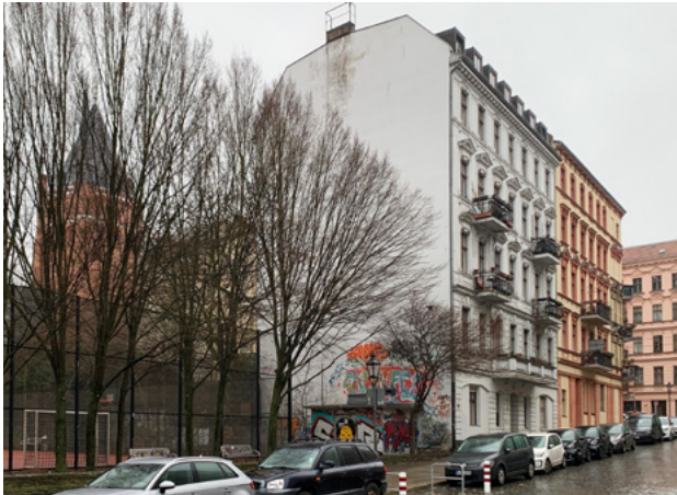
Abb. 7: Brandwand in einem Denkmalbereich