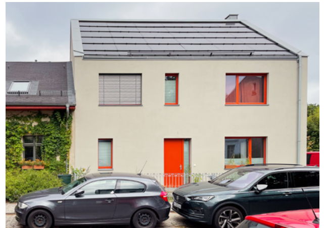
Abb. 8: Dachintegrierte PV-Anlage auf Neubau neben einem Denkmal

In der Umgebung von Denkmälern sollen Solaranlagen so beschaffen sein, dass sie keine visuelle Beeinträchtigung des Denkmalbereiches oder des Denkmals erzeugen. Standardmodule in angemessener Gestaltung sind möglich.