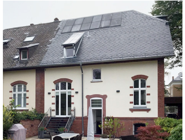
Abb. 11: Farbliche Anpassung einer PV-Anlage an die Dachdeckung durch Auswahl monochromer, matter Module