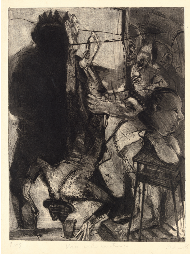
Michael Diller · Mal wieder was Farbiges 1986 · Radierung auf Hahnemühle-Bütten 64,2 x 49 cm / 76,5 x 57 cm Kunstsammlung Pankow