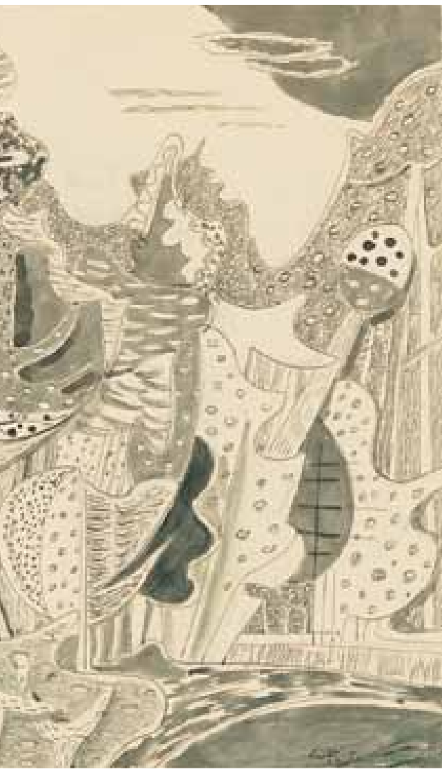
Waldemar Rösler - Aus dem Skizzenbuch - o. J. - Bleistift auf Papier - 22,7 x 29 cm

realistisch und überhört zugleich. Anders, aufgehehlt und wie geläutert, zeigt sich die Landschaft in seinen Blättern von der Ostsee. Das Fischerdorf Klein Kuhren war sein sommerlicher Rückzugsort – nicht Nidden, die Künstlerkolonie an der Kurischen Nehrung. Zwar gab es auch hier einen Badebetrieb, den er ausgiebig zeichnete, doch der Ort war bescheiden, kein modischer Treffpunkt Gleichgesinnter. Was Waldemar Rösler dort sah, war nicht unbedingt idyllisch, aber