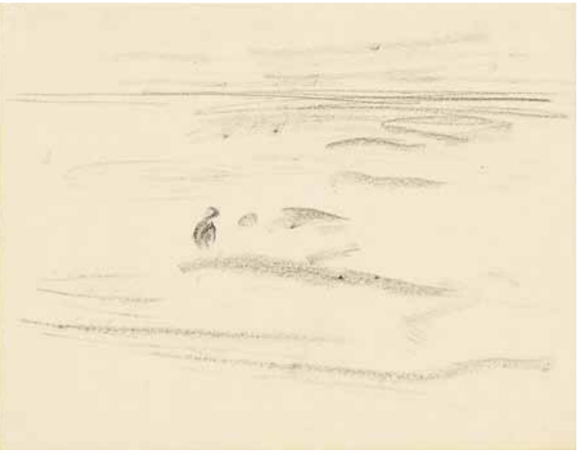
Waldemar Rösler - Aus dem Skizzenbuch - o. J. - Bleistift auf Papier - 22,7 x 29 cm

Kunst sah, ein Weggefährte Corinths und enger Freund Beckmanns. Ähnlich wie damals Max Beckmann hatte Rösler nur wenig Zugang zu den Strömungen der Vorkriegs-Avantgarde: zu Kubismus, Futurismus, Expressionismus und abstrakten Tendenzen. Dennoch ging er malerisch – und das zeigen gerade die Landschaften von der ostpreußischen Küste – bereits über den so treffsicheren, gewandten und erscheinungsgetreuen Impressionismus Liebermanns hinaus. Das erhaltene grafische Werk besteht aus vornehmlich mit Kreide auf Stein, Zink oder Umdruckpapier gearbeiteten Lithografien und wenigen Zeichnungen. Es gibt zart empfundene Akte, aber das Landschaftsujet überwiegt: äußerst spröde Motive aus Lichterfelde, damals noch ein Randbezirk Berlins, im Spätherbst, Winter und Vorfrühling, ein ganz und gar unlieblicher, bizarrer Landschaftsbefund mit Bahnschwellen, Schienensträngen, Telegrafmasten und den nackten Silhouetten der vom Wind der kalten Jahreszeit um die letzten Blätter gebrachten Bäume. Röslers Zugriff auf den Anblick solcher der Stadt eben zugeschlagener Areale war gnadenlos