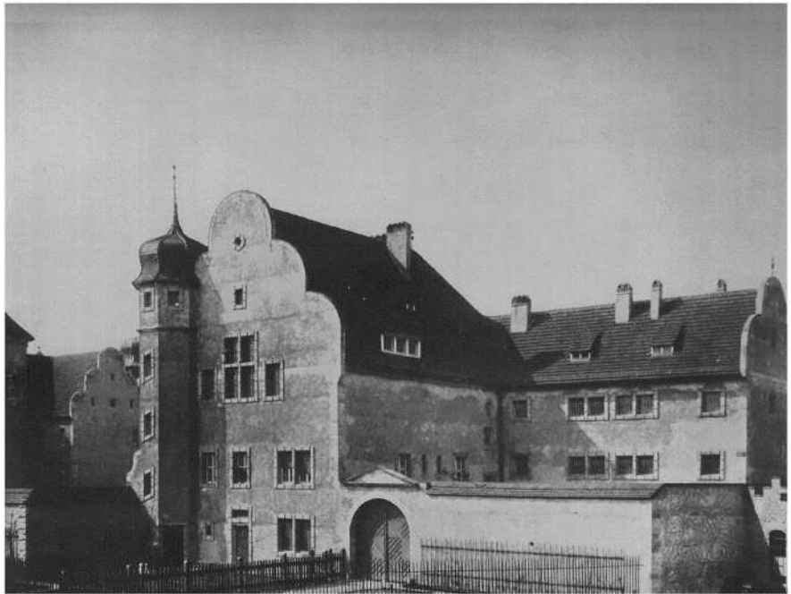
Amtsgerichtsgefängnis Groß-Lichterfelde (nach 1906); Quelle: unbekannt

Für minderjährige Straftäter waren in Berlin noch zwei weitere Vollzugsobjekte zuständig. Das ursprüngliche Gerichtsgefängnis Lichtenfelde in der Söhtstraße 7 entstand wie die Verwahrhäuser in Lichtenberg, Pankow und Berlin-Schöneberg im Zusammenhang mit der Reform der preußischen „Gerichtsordnung für Berlin“ Anfang des 20. Jahrhunderts. 45 In der ersten Hälfte der 1940er Jahre wurde es als Jugendarrestanstalt genutzt. 46 Ausgestattet mit