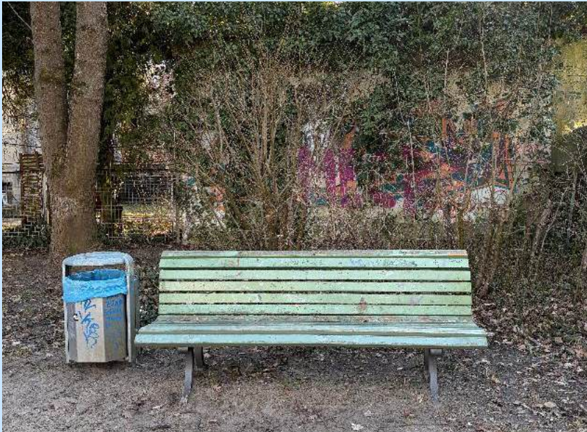
Sitzgelegenheit für Eltern und Großeltern