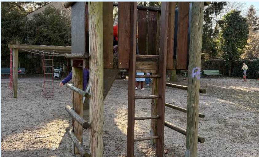
Spielturm mit Rutsche