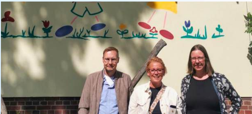
Vorstand Förderverein Karower Knirpse