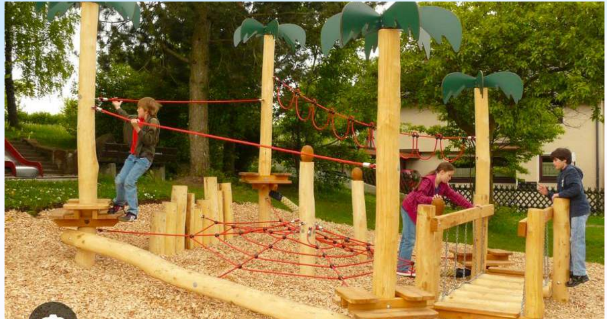
Beispiel von Seibel Spielgeräte