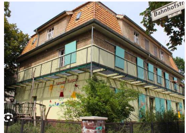
Kita Karower Knirpse