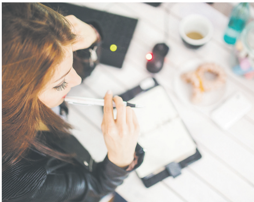
Der Vorteil des Dualen Studiums ist die Verknüpfung von Theorie und beruflicher Praxis. Es dauert je nach Modell zwischen drei und fünf Jahre.

Doch ein duales Studium ist anspruchsvoll. Es erfordert eine möglichst gute Fachhochschulreife oder Abitur. Auch müssen sich Interessierte frühzeitig, oftmals über ein Jahr vor Studienbeginn bei Arbeitgebern bewerben. Wird dann ein Ausbildungsvertrag für ein duales Studium mit dem Unternehmen geschlossen, erhält man die Zulassung für eine kooperierende Hochschule. Das duale Studium dauert je nach Modell drei bis fünf