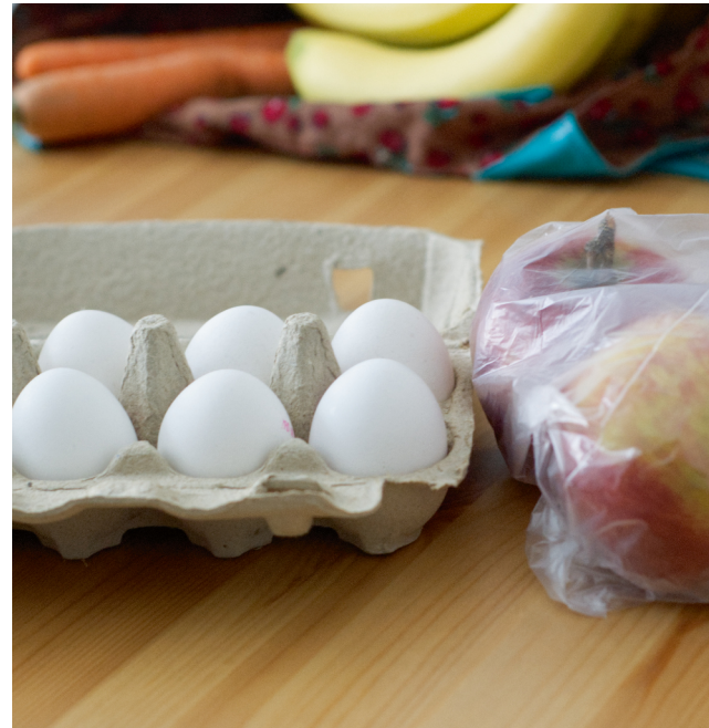
Sinnvolle und überflüssige Verpackungen: Karton schützt die zerbrechlichen Eierschalen beim Transport, die Äpfel überstehen auch ohne Plastiktüte den Heimweg.

Um den steigenden Müllmengen, der Verschmutzung der Weltmeere und Mikroplastik in der Nahrungskette entgegenzuwirken, ist es sinnvoll, nicht notwendige Verpackungen von Anfang an zu vermeiden. Es gilt: So viel wie nötig, so wenig wie möglich.