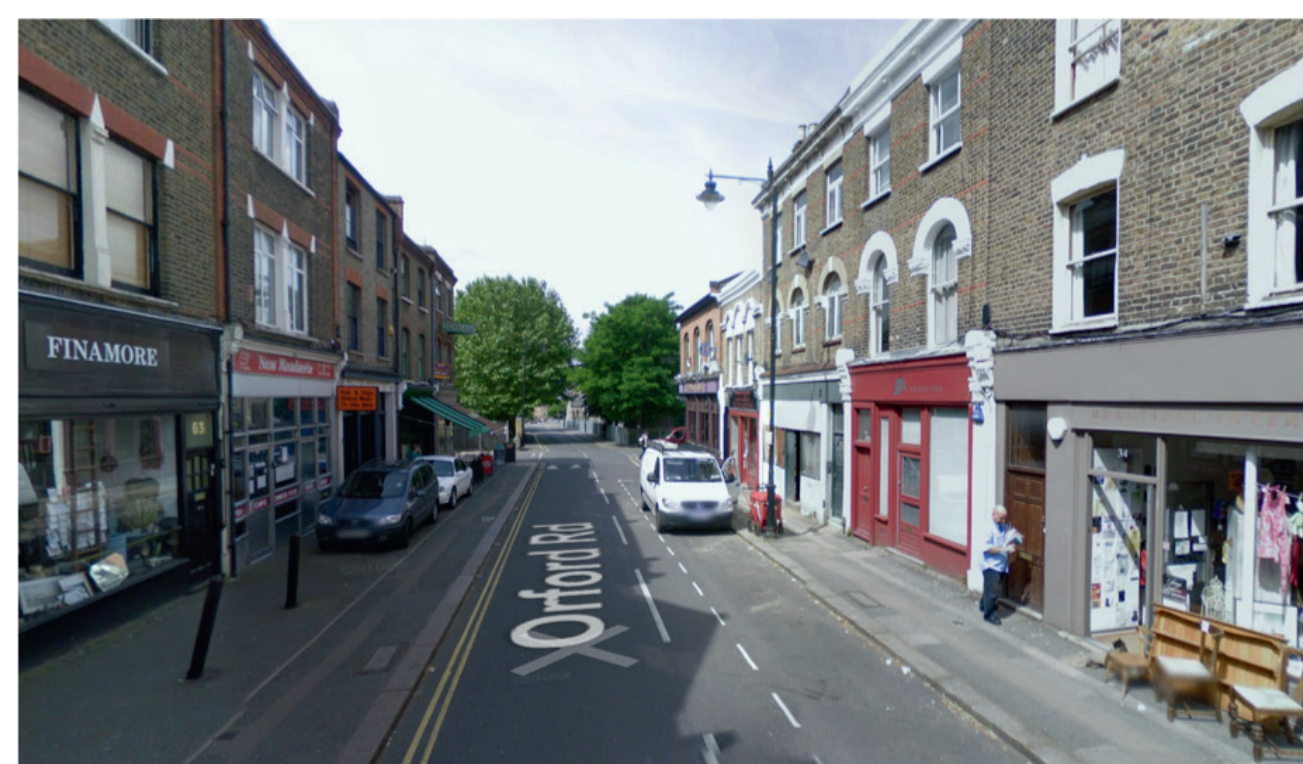
vorher (links) Bildquelle: Bernhard Ensink nachher (rechts) Bildquelle: Bernhard Ensink