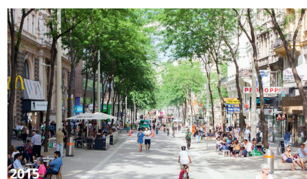
vorher (links) nachher (rechts)