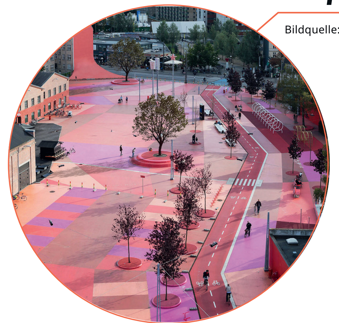
Bildquelle: Iwan Baan