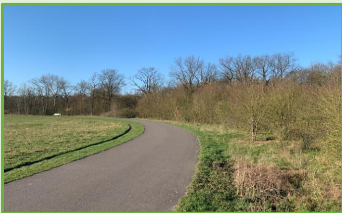
Pioniergehölzbestand nördlich der Skatebahn