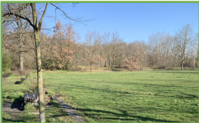
Lichtungsbereich südwestlich der Skatebahn