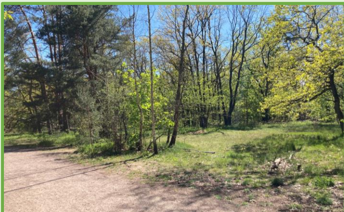
Blick vom angrenzenden Weg in die Fläche