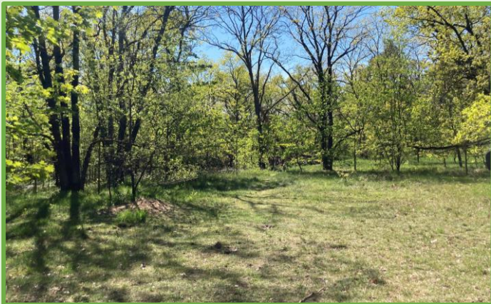
Offenbereich mit Magerrasen