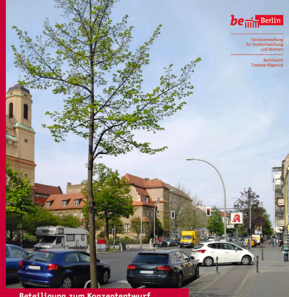
Beteiligung zum Konzeptentwurf