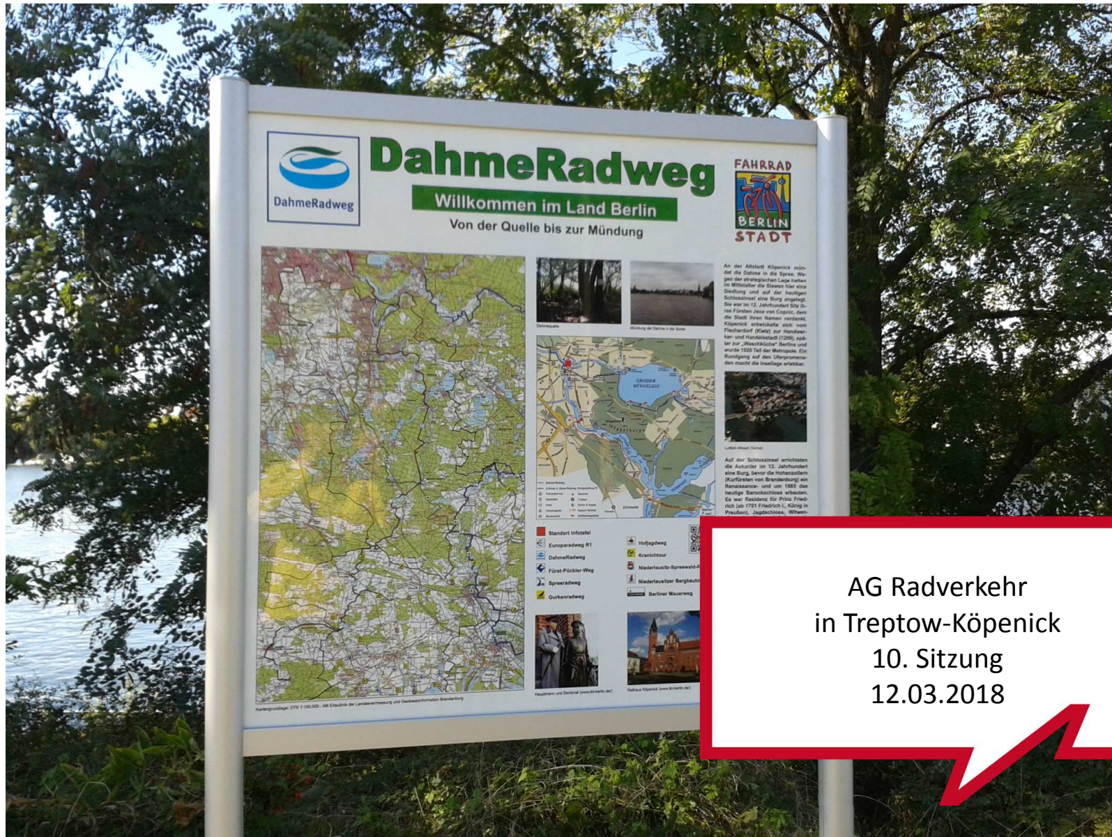
10. Sitzung AG Radverkehr Stadtplanung Treptow-Köpenick 12.03.2018