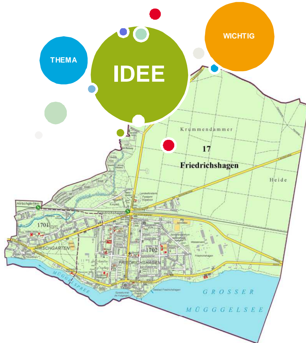
Karte: © Bezirksamt Treptow-Köpenick

Wie stellen Sie sich Ihren Ortsteil im Jahre 2050 vor?