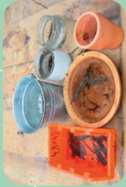
Typische Kleinbrutstätten der Tigermücke

Die Eier kleben in den Gefäßen und überstehen auch Trockenheit und kalte Winter. Belebte Gartenteiche und Fließgewässer sind keine Brutstätten! Bei Tiertränken sollte das Wasser mindestens alle fünf Tage gewechselt werden.