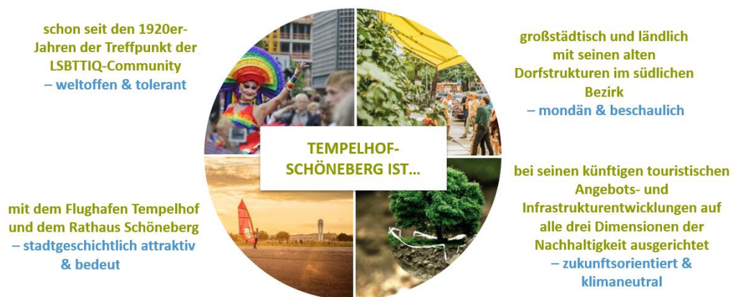
Abb. 2 Touristisches Leitbild des Bezirks Tempelhof-Schöneberg