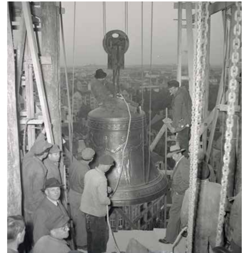
Right: Installation of the bell in the Schöneberg city hall tower.