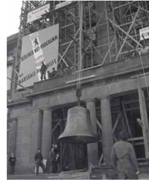
Oben: Die Glocke wird 60 Meter hoch per Flaschenzug in den Rathaustrurm gezogen.