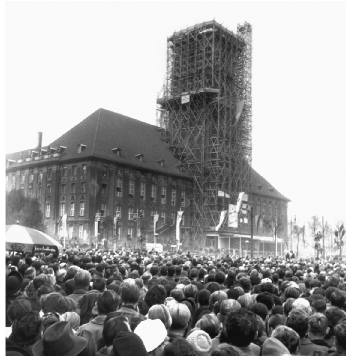
Audience with more than 400,000 people at the inauguration of the Freedom Bell on Rudolph-Wilde-Platz.