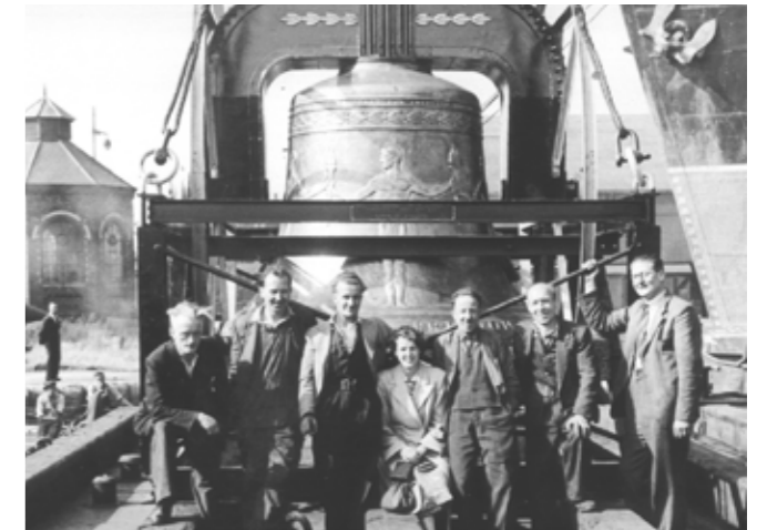
Mitarbeiter_innen der Firma Gillett & Johnston vor der Freiheitsglocke an den Docks in London, 1950. Employees of Gillett & Johnston in front of the Freedom Bell in London, 1950.

radio station with donations from the American people, a strong symbol had to be created to raise patriotic emotions and to serve as an identification for the oppressed nations' fight for freedom. The decision was made to cast a replica of the Liberty Bell—the bell that heralded the American Independence in 1776 embodying the values of freedom and self-determination like no other object as a national sanctuary of the United States. Inspired by its historic travels across the country for symbolic exhibition and visualization purposes, the envisaged Berlin Freedom Bell was to embark on a journey through 26 federal states of the USA—however this time being embedded into an openly anti-communist campaign with the title Crusade for Freedom. Its implementation and the development of the radio station were entrusted to the then chairman of the National Committee and General Lucius D. Clay, who was already closely associated with Berlin's young post-war history. In the context of the bell's journey—which later has been exposed as partly financed by the American government and Intelligence Agency—about 16 million American citizens signed a petition with the Declaration of Freedom and donated 1.3 million dollars to cast the bell and to set up the radio station Radio Free Europe. It launched with its first broadcast from Munich on 4th