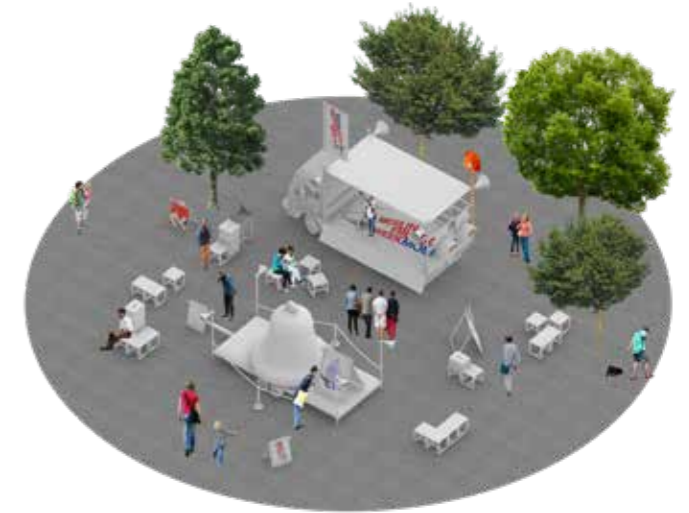
Die Freiheitsglocke wird von Berliner Kindern am Rathaus Schöneberg empfangen. | The Freedom Bell is received by Berlin children at Schöneberg Town Hall.