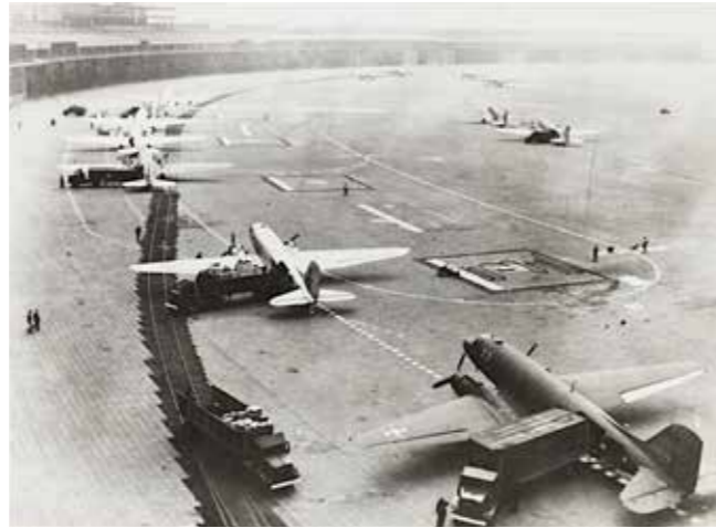
Flieger auf dem Flughafen Tempelhof. Airplanes at Tempelhof Airport.

Nach dem Ende des Zweiten Weltkrieges standen Deutschland und insbesondere seine Hauptstadt Berlin als ehemaliges Machtzentrum der nationalsozialistischen Gewaltherrschaft vor den großen Aufgaben der Beseitigung von Kriegsschäden und des Neuaufbaus seiner baulichen, gesellschaftlichen und politischen Strukturen. Im Jahr 1945 lebten noch ungefähr 2,8 Millionen Einwohner_innen der vormals vier Millionen Menschen zählenden Metropole im Stadtgebiet. In den Monaten Juli und August desselben Jahres einigten sich die vier Siegermächte gemäß den Londoner Zonenprotokollen über die Aufteilung und Administration von Berlin. Mit der Einrichtung der Alliierten Kommandantur in Berlin-Dahlem und des Alliierten Kontrollrates im ehemaligen Kammergerichtsgebäude in der Elßholzstraße in Schöneberg verfolgten die Siegermächte anfänglich noch das Ziel, gemeinsam an einer gesamtdeutschen Lösung für die Hauptstadt und das Staatsgebilde zu arbeiten. Grundlegende Meinungsverschiedenheiten sowie die Auseinandersetzung um Macht und Einflusszonen zwischen Ost und West ließen in den folgenden Jahren die Unvereinbarkeit der politischen Vorstellungen der West-Alliierten