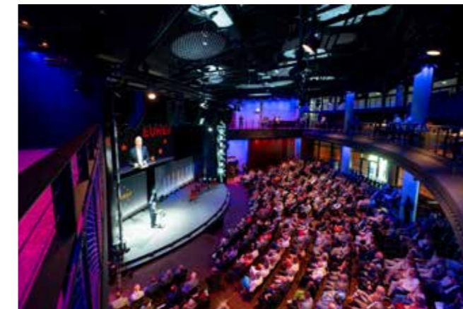
Tagungsort Gasometer auf dem EUREF-Campus. | Conference venue: Gasometer at the EUREF Campus:

Die „Berlin Freedom Conference“ will das ändern. Die zentrale Konferenz der „Berlin Freedom Week“ bringt am 10. November starke Stimmen aus internationaler Politik, Wirtschaft, Zivilgesellschaft, Kultur und den Medien zusammen – für neue Perspektiven, Allianzen und konkrete gemeinsame Antworten zur Verteidigung und Stärkung von Freiheit weltweit.