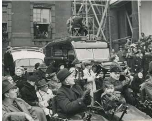
Einweihung der Freiheitsglocke vor dem Rathaus Schöneberg mit der Live-Übertragung des RIAS. Inauguration of the Freedom Bell in front of City Hall Schöneberg, broadcasted live by RIAS.

Im Beisein von mehr als 400.000 Berliner_innen begann der Festakt zur Übergabe, Weihe und zum Einläuten der Freiheitsglocke am 24. Oktober 1950 um 10:45 Uhr mit einer Darbietung des RIAS Symphonie Orchesters und den anschließenden Reden des amerikanischen Kommandanten Berlins, Generalmajor Maxwell D. Taylor, des amerikanischen Hohen Kommissar in Deutschland, John McCloy, des Oberbürgermeisters von Berlin, Ernst Reuter, und des Vorsitzenden des Nationalkomitees für ein Freies Europa, General Lucius D. Clay. Letzterer sollte um 12:00 Uhr durch das Betätigen des elektronischen Läutesignals den ersten Glockenschlag auslösen. Das Versagen der Sicherungen für die Motorenantriebe der Glocke führte dazu, dass das erste Geläut von zu diesem Zeitpunkt in der Glockenstube anwesenden Berliner Handwerker_innen von Hand eingeleitet wurde. Die unterzeichneten Unterschriftenlisten mit dem Freiheitsschwur werden heute unterhalb der Glocke im Turm des Schöneberger Rathauses aufbewahrt.