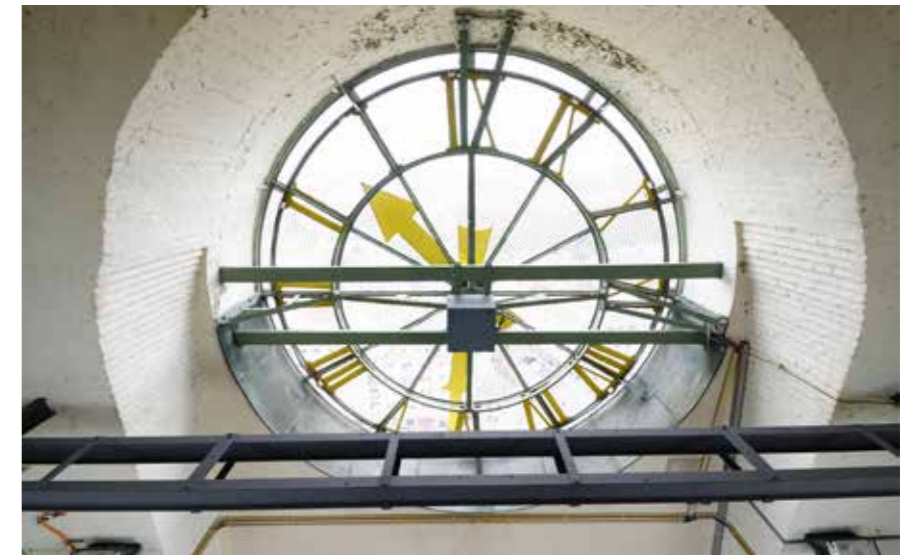
Die Freiheitsglocke und Details im Turm des Rathauses Schöneberg.