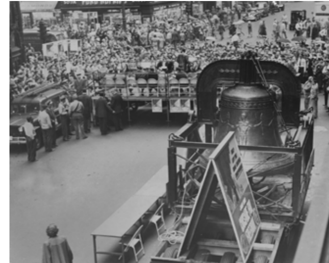
12. September 1950: Symbol des amerikanischen Freiheitsbekenntnisses ist die riesige Freiheitsglocke, die am Dienstagnachmittag zum landesweiten „Kreuzzug für die Freiheit“ an der Ecke State und Madison Straße läutete. September 12, 1950: Symbol of American devotion to liberty is the giant Freedom Bell that rang at State and Madison sts. Tuesday afternoon for the nation-wide “Crusade for Freedom”.

Unter enormem Zeitdruck wurde die Glocke am 27. Juli 1950 gegossen und bereits am 25. August auf das Schiff American Clipper am Victoria Dock in London transportiert, von wo aus ihre Reise in die USA und der anschließende Kreuzzug für die Freiheit begannen. Am 20. Oktober 1950 erreichte die Freiheitsglocke auf dem Schiff General Blatchford Bremerhaven und wurde mit einem speziell präparierten Militärzug über Nacht zum Bahnhof Lichterfelde