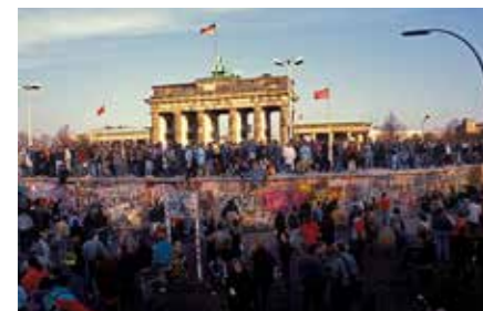
Menschen auf der Berliner Mauer am Brandenburger Tor am Tag nach dem Mauerfall am 10.11.1989. | People on the Berlin Wall at the Brandenburg Gate the day after the fall of the Wall, November 10 1989.