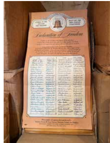
„Hier liegen die Unterschriften Millionen amerikanischer Bürger, die das Manifest für die Freiheit unterzeichnet haben“, so der Schriftzug über dem Eingang der Dokumentenkammer. Rechts: Einblicke in die Dokumentenkammer, wo hunderte Pakete mit den Unterschriften aufbewahrt werden.