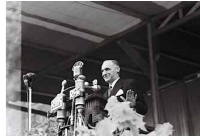
Oberbürgermeister Ernst Reuter (oben) und Militärgouverneur Lucius D. Clay bei ihrer Rede anlässlich der Übergabe der Berliner Freiheitsglocke vor dem Rathaus Schöneberg. Mayor Ernst Reuter (above) and Military Governor Lucius D. Clay during their speech on the occasion of the handover of the Berlin Freedom Bell in front of Schöneberg Town Hall.

head mayor of Berlin Ernst Reuter and the chairman of the National Committee for a Free Europe Lucius D. Clay. The latter was supposed to initiate the first ringing via an electronic device. The failure of the fuses for the bell's motor drives meant that the first ringing was initiated by hand by Berlin craftsmen present in the belfry at the time. The signed Declaration of Freedom petitions are stored beneath the bell inside the tower of Schöneberg's city hall to this day.