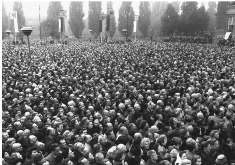
Publikum mit mehr als 400.000 Menschen bei der Einweihung der Freiheitsglocke auf dem Rudolph-Wilde-Platz.