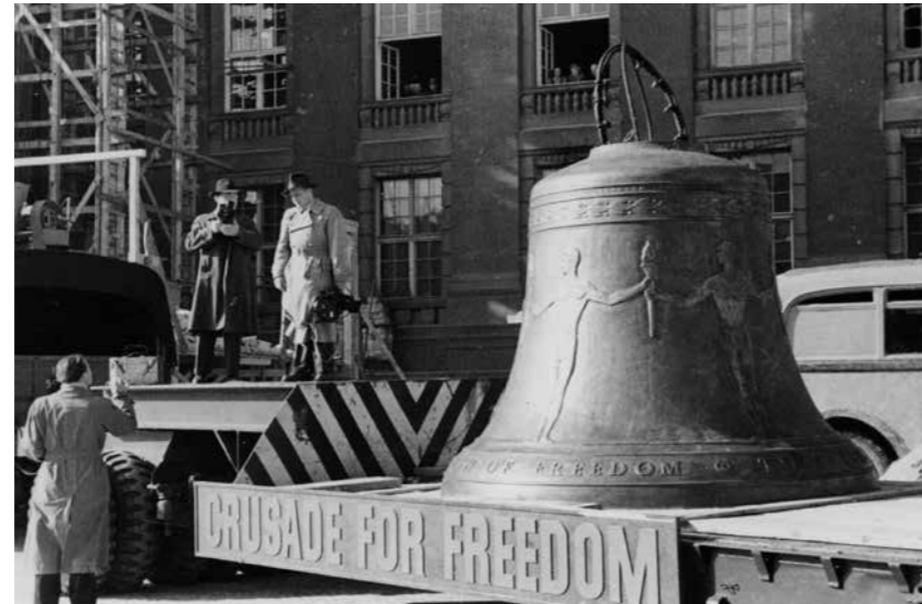
Right: The Berlin Freedom Bell arrives at Schöneberg City Hall.