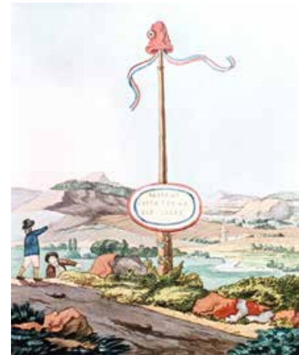
Aquarell eines Freiheitsbaumes von Johann Wolfgang von Goethe. | Watercolor of a Liberty Tree by Johann Wolfgang von Goethe.

Das Berlin Freedom Week Mobil ist das mobile Herzstück der Berlin Freedom Week 2025. Es bringt die Themen Freiheit und Demokratie direkt in den Stadtraum: mit einer Bühne für Reden, Gespräche und Projektionen, einem Nachbau der Berliner Freiheitsglocke mit Klanginstallation, einem weithin sichtbaren Freiheitsbaum, Audiostationen mit Stimmen von Dissident_innen sowie einem Partizipationsmodul, das Besucher_innen einlädt, ihre eigenen Antworten auf die Frage „Was bedeutet Freiheit für mich?“ zu hinterlassen.