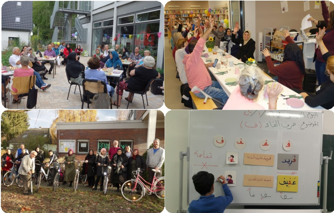
Fotos (von oben links nach unten rechts): Ehrenamtsstammtisch auf der Terrasse der Stadtteilbibliothek, Lange Tafel der Nachbarschaften, Fahrradspendenaktion, Arabisch-Kurs für Kinder.

Arbeitsgemeinschaft für Sozialplanung und angewandte Stadtforschung e. V. - AG SPAS Berlin, April 2020