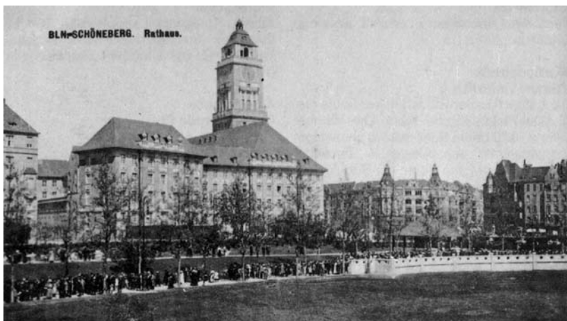
Blick auf das Rathaus Schöneberg mit Rudolph-Wilde-Park um 1916