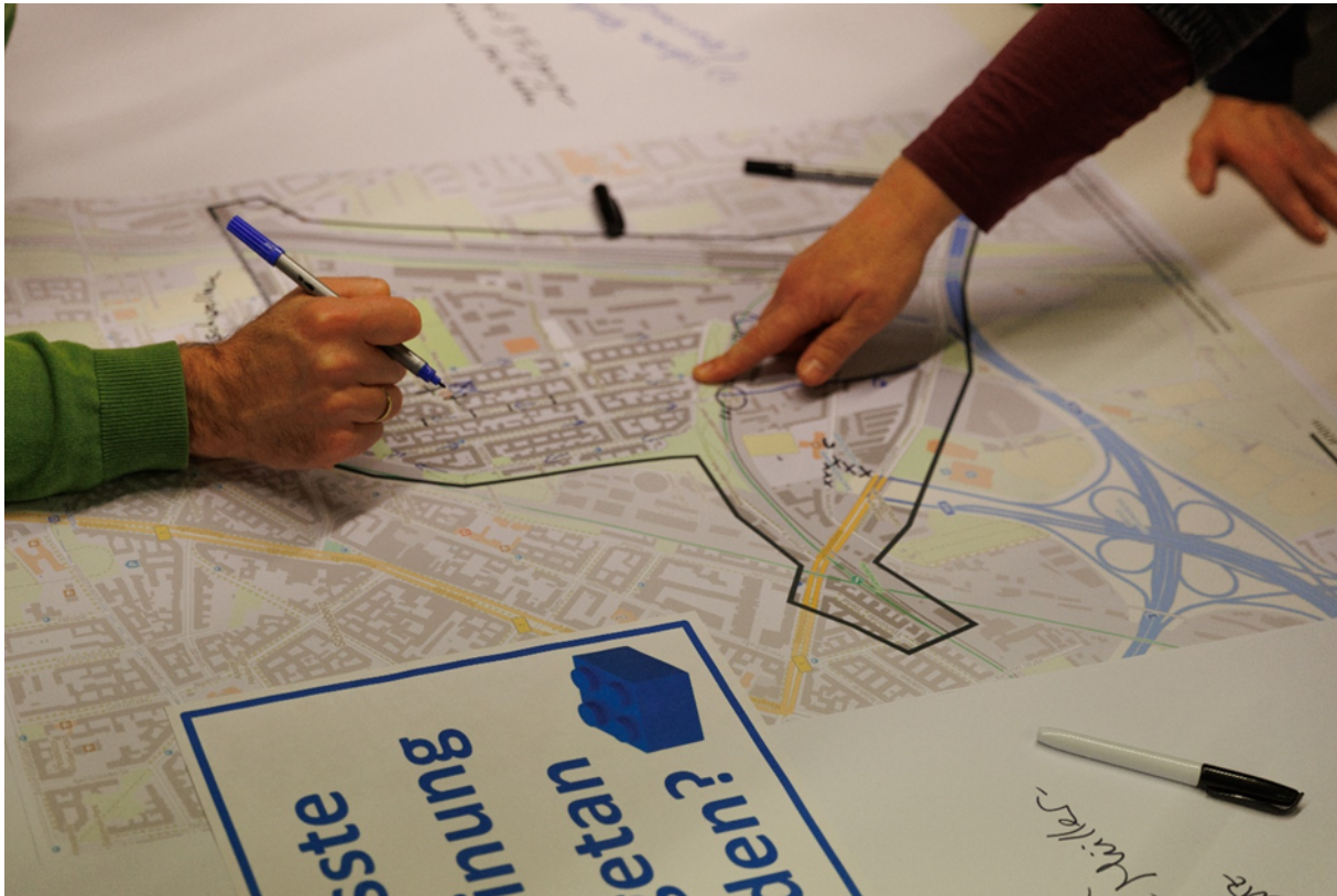
Abbildung 2: © B. Gericke

den Bürgerinnen und Bürgern von Tempelhof-Schöneberg an einer lebenswerten Umgebung gelegen ist.