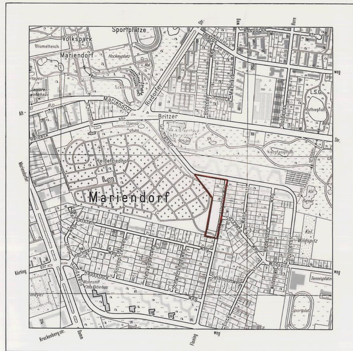
Ausschnitt aus dem Flächennutzungsplan Berlin - FNP 94