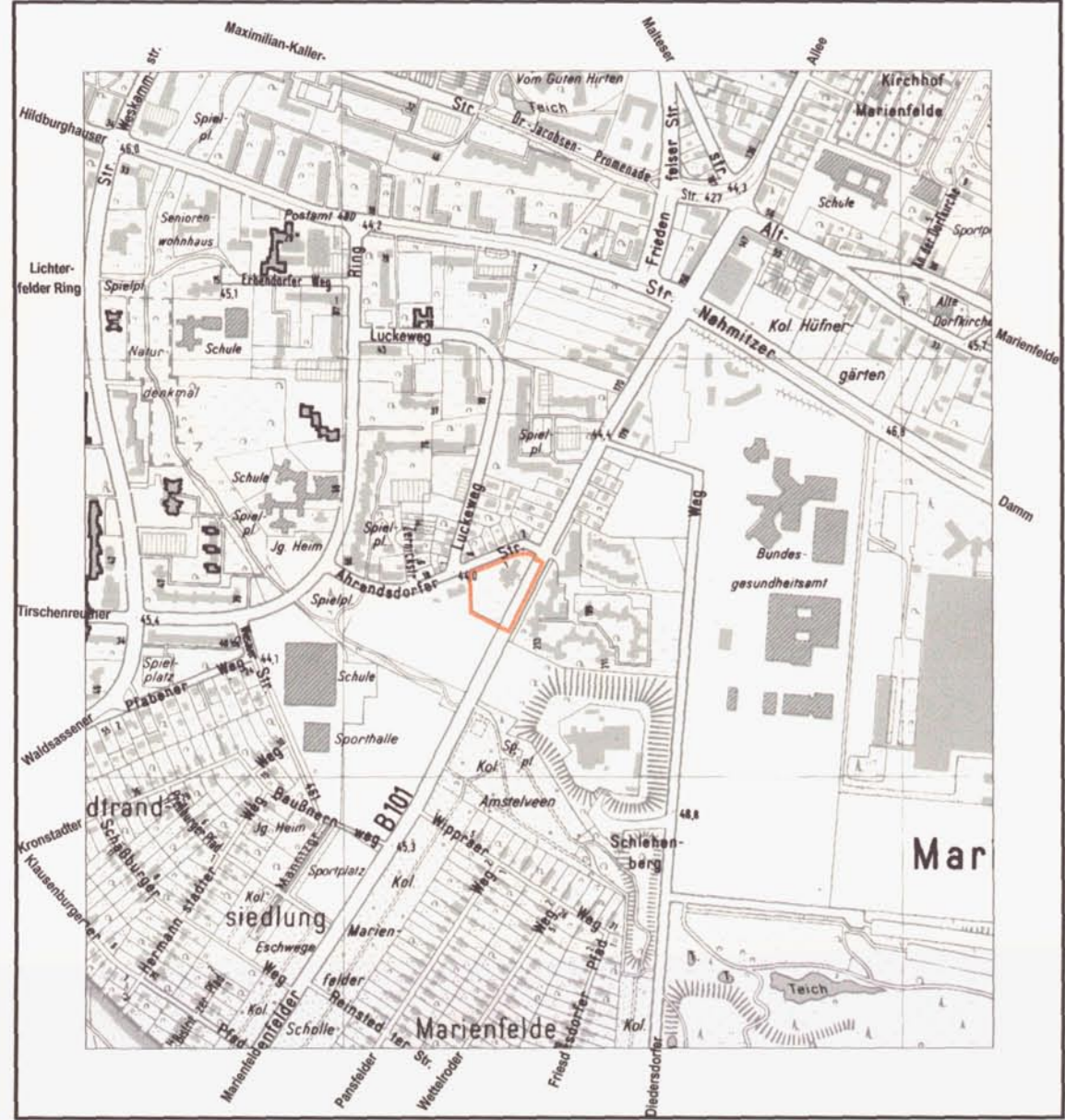
Übersichtskarte 1 : 10 000