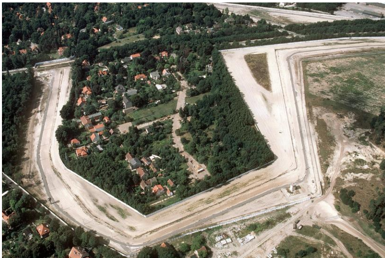
Foto: Luftaufnahme der Exklave Steinstücken, 1989.

Veranstalter: Fb Kultur Steglitz-Zehlendorf