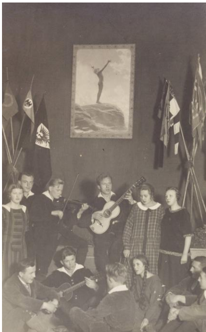
Wandervogel meets Lichtgebet

6. November, Schwartzsche Villa, Großer Salon