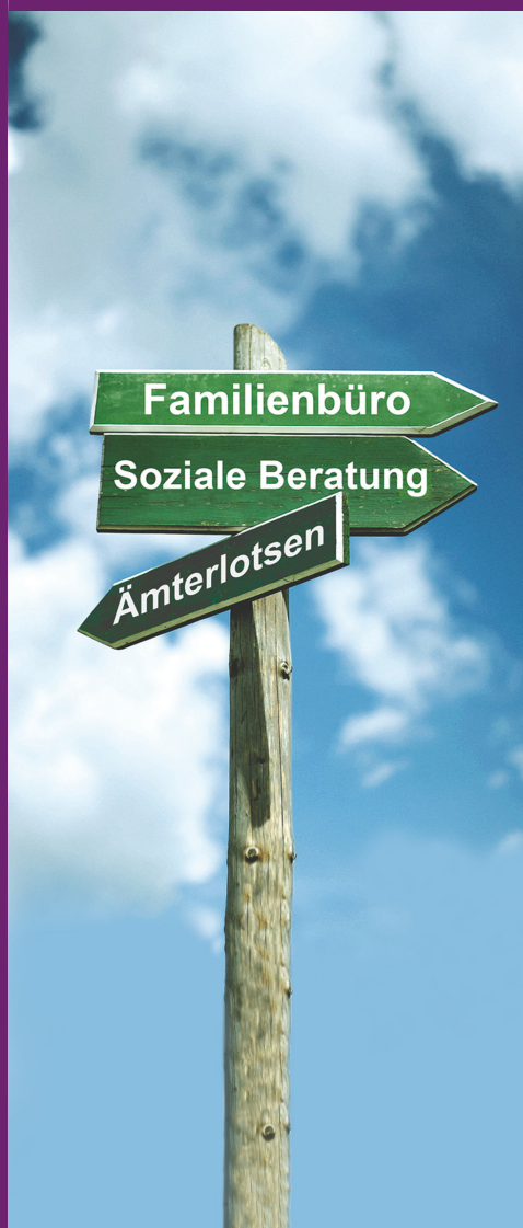
Abbildung: Matthias Entner/Fotolia.com; Stand: Februar 2019