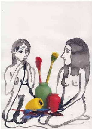
Niina Lehtonen Braun: Ohne Titel, aus der Serie „My Body Is My Studio“, Tinte & Collage auf Papier, 29,7 x 21 cm, 2025