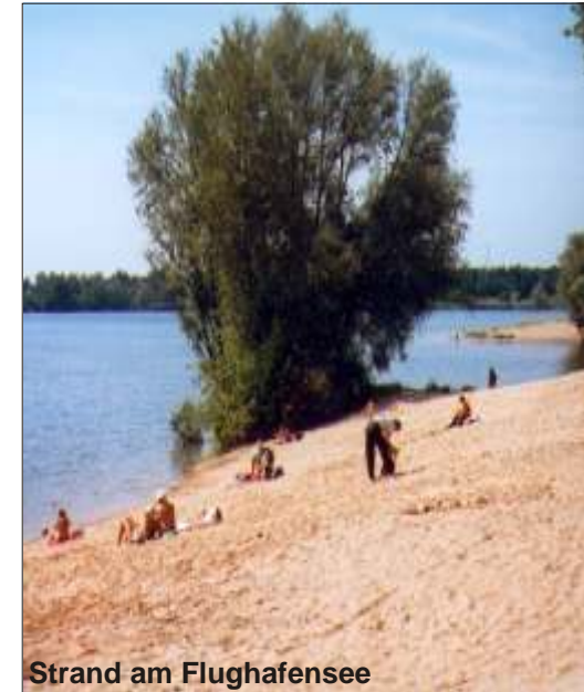
Strand am Flughafenensee