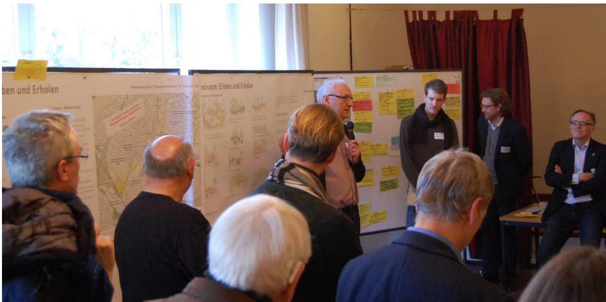
Abbildung 8: Station „Freiraum: Erleben und Erholen“