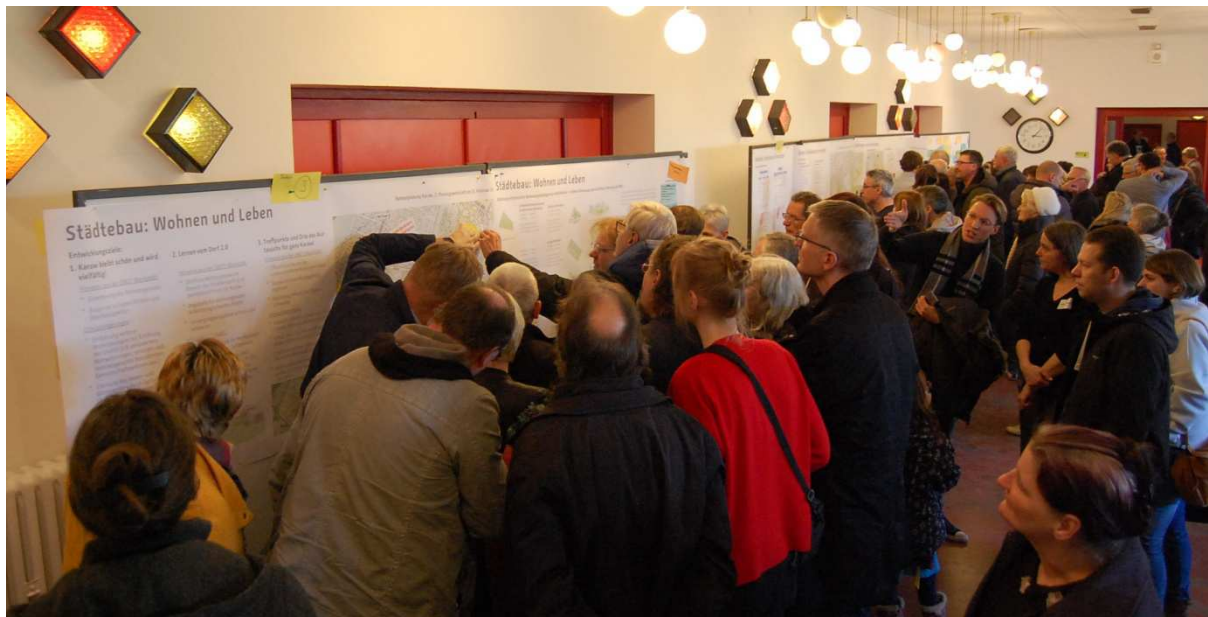
Abbildung 6: Station "Städtebau: Wohnen und Leben"