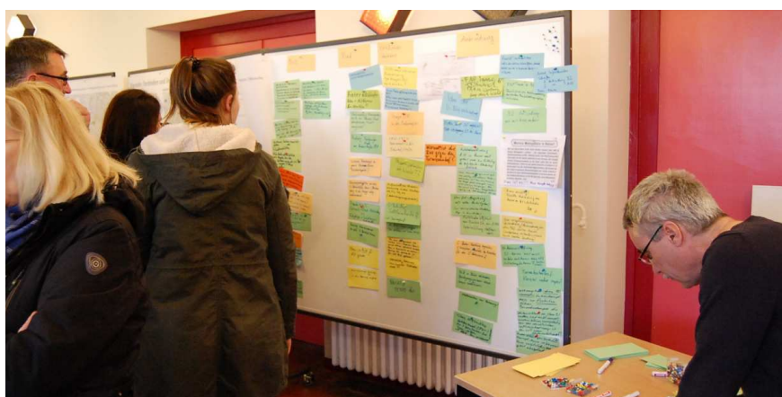
Abbildung 7: Station "Verkehr: Verbinden und Vernetzen"

Die thematisch zusammengefassten Hinweise sowie ergänzende Informationen, wie im weiteren Verfahren damit umgegangen wird, sind in den folgenden Unterkapiteln dargestellt.