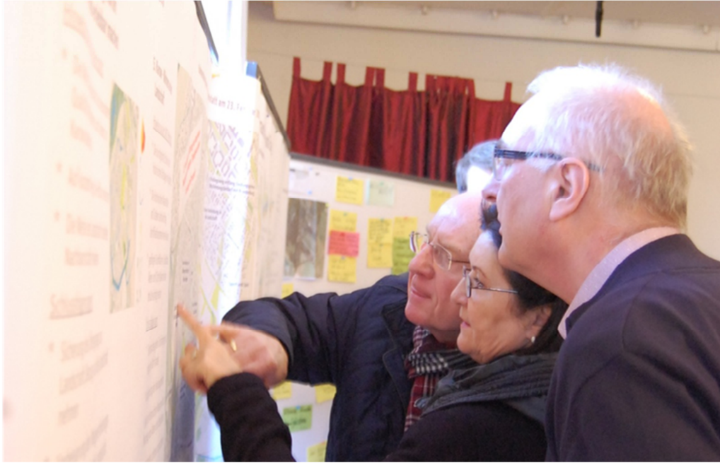
Abbildung 5: Darstellung der Entwicklungsziele auf großflächigen Plakaten und Plandarstellungen

Im Folgenden werden die von den Fachplaner*innen aus der Beteiligung abgeleiteten sieben Entwicklungsziele vorgestellt.