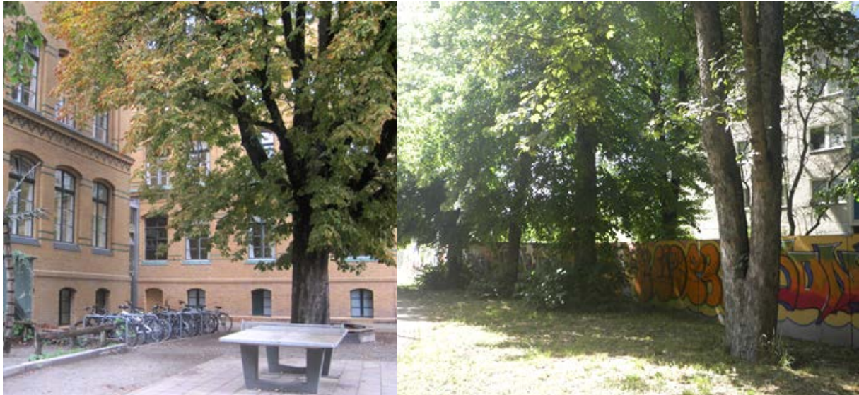
Abb. 4 Kastanien-Altbaum auf dem Gelände der Reinhold-Burger-Oberschule (Bild l.) sowie Baumreihe aus Winter-Linde auf dem im B-Plan-Gebiet zentral gelegenen Spielplatz (Bild r.)

Die Spielflächen des zentral im Plangebiet gelegenen Spielplatzes sind dem Biototyp 10200 zugehörig, wobei diese von Hecken (07135121), Zierrasen (05160), Einzelgehölzen und Baumgruppen gesäumt werden (s. Abb. 5). An das Schulgebäude im Norden angrenzende Spielflächen gehören ebenfalls jenem Biototyp an (s. Abb. 7, rechtes Bild). Die Spielflächen sind ohne naturschutzfachlichen Wert.