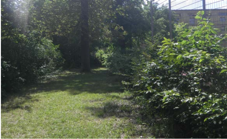
Abb. 3 Scherrasen innerhalb des öffentlichen Spielplatzes inkl. einer rechtsseitig angrenzenden Hecke (BT 07135121)

Im Plangebiet sind mehrere gehölzgeprägte Biotope verschiedener Ausprägung vorhanden. Diese umfassen die folgenden Biototypen: