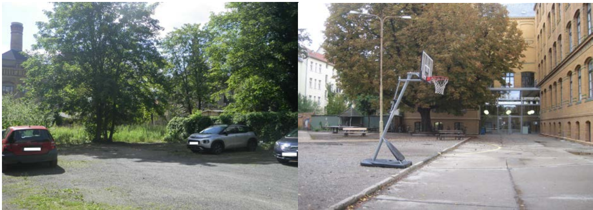
Abb. 7 Parkplatz (12642) mit Übergang zur angrenzenden Ruderalfläche (03243) (Bild l.) sowie Blick auf das Schulgebäude der Reinhold-Burger-Oberschule (12330) inkl. angrenzendem Schulhof (10200, 12750) (Bild r.)

Im Süden des Plangebietes befindet sich ein teilversiegelter Parkplatz ( 12642 ) (s. Abb. 7, linkes Bild). Die daran anschließende Verkehrsfläche ( 12611 , 12612 ) verbindet hierbei den Parkplatz mit den beiden zuvor genannten Straßen.