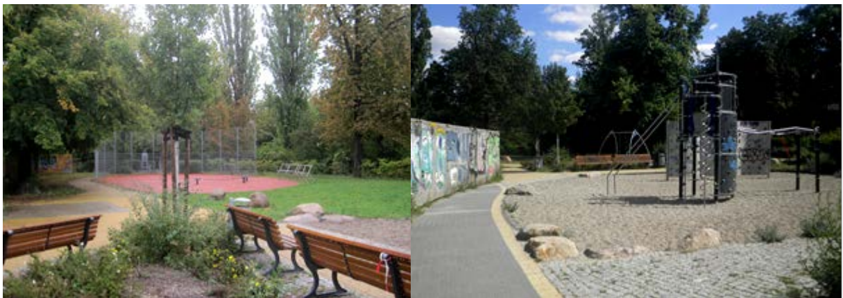
Abb. 5 Spielplatz mit mehreren Spielflächen, Hecken, Zierrasen, Gehölzen und befestigten Flächen

Auf dem Grundstück des zentral gelegenen Spielplatzes befindet sich darüber hinaus eine kleine Strauchanpflanzung aus Strauch-Fingerkraut ( Potentilla fruticosa ), welche zwei junge Feld-Ahorn-Anpflanzungen beinhaltet (s. Abb. 5, linkes Bild, Pflanzung im Vordergrund). Das Biotop ist von geringem naturschutzfachlichem Wert.