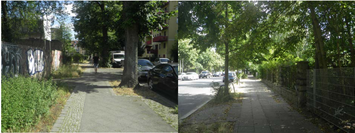
Abb. 6 Neue Schönholzer Straße (Bild l.) und Mühlenstraße (Bild r.) mit beidseitigem Gehweg und Lindenbestand