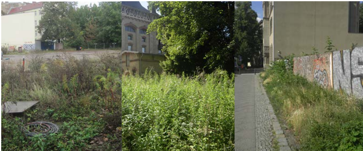
Abb. 2 Anthropogene Ruderalflächen im B-Plangebiet 3-34: 0324222 (Bild l.), 03243 (Bild m.), 03249 (Bild r.)

Entlang der im Westen des B-Plangebietes verlaufenden Schönholzer Straße befindet sich der Biotoptyp 03249 (Sonstige ruderaler Staudenfluren) (s. Abb. 2, Bild rechts). Der Bestand wird durch Brennessel und Mäusegerste ( Hordeum murinum ) dominiert und ist insgesamt von geringem naturschutzfachlichem Wert.