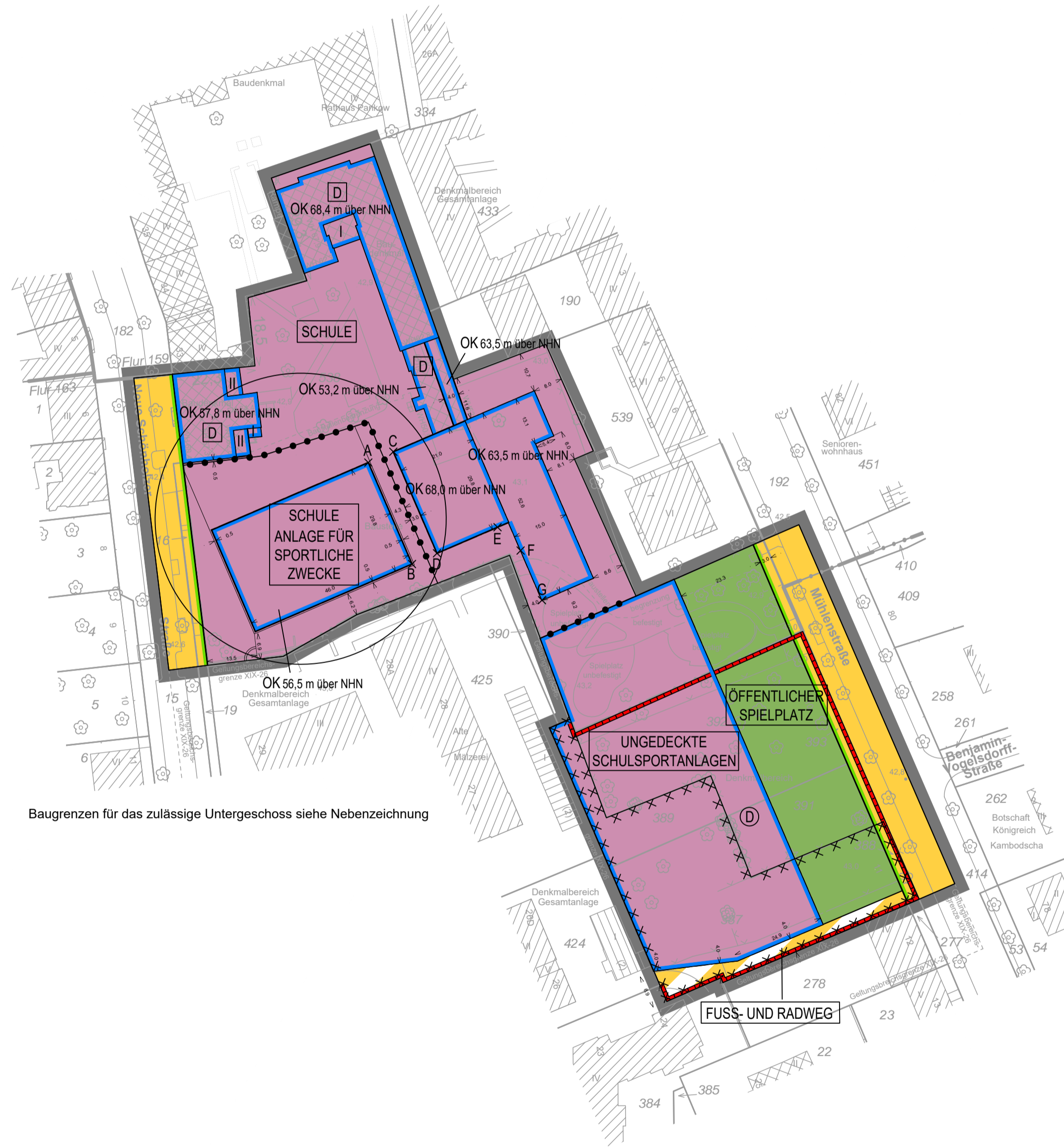
Baugrenzen für das zulässige Untergeschoss siehe Nebenzeichnung