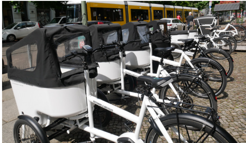
Lastenräder zum Verleihen in Berlin Prenzlauer Berg

Das Projekt ermöglichte es, ämter- und abteilungsübergreifende Kommunikationsprozesse anzustoßen. Hierbei handelt es sich um eine der zentralen Wirkungen des Projekts. In einem informellen Rahmen und über Methoden wie Fokusgruppen und World Cafés wurden Akteur*innen zusammengebracht, die normalerweise kaum miteinander ins Gespräch kamen. Die Beteiligten kamen etwa aus Ämtern der Bereiche Straßen- und Grünflächen, Umwelt sowie Soziales, darüber hinaus auch aus verschiedenen politischen Ebenen und Fachbereichen, dem Senat sowie der Zivilbevölkerung.