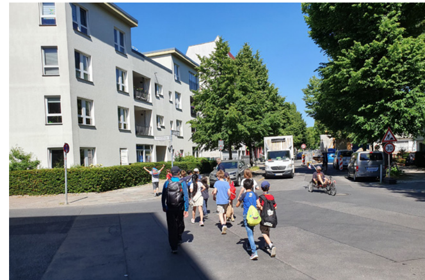
Impulse für die Verkehrsplanung: wie können Bedingungen für den Fußverkehr verbessert werden?

Das Projekt bewirkte hier mehr Handlungsfähigkeit auf der Ebene des Bezirks Pankow, indem Verkehrsplanung überhaupt auf dieser Ebene installiert wurde. Gleichzeitig sorgte es für eine stärkere Einbindung der subjektiven Wahrnehmungen und Perspektiven der lokalen Bevölkerung bezüglich der Mobilität in Pankow. Dies geschah mithilfe qualitativer, beteiligender Methoden – wie etwa Community Mapping – im Rahmen des Planungsprozesses und der neuen Stelle der Mobilitätsbeauftragten. Um diese Veränderungen zu erreichen, musste zuerst Akzeptanz für diese neue Art der Verkehrsplanung geschaffen werden, in der die Mobilität und die Perspektive der Menschen in die verkehrsrelevanten Entscheidungen einfließen können.