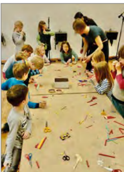
Galerie Parterre

In dem Workshop erwartet dich eine bunte Ansammlung von Strohhalmen, Papptellern, Kronkorken und weiteren Alltagsgegenständen. Du wirst erfahren, wie du aus den Fundsachen tönende und fein klingende Instrumente bauen kannst. Die Klangkörper können anschließend farbig gestaltet werden und vielleicht komponiert ihr am Ende sogar ein kleines Musikstück darauf.