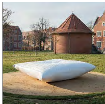
Patricia Pisani: Denkzeichen für die Opfer der NS-Euthanasie-Morde in Berlin-Buch

Anmeldung: info@galerie-pankow.de , 4753-7925