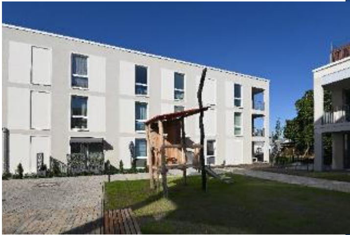
Beispielobjekt STADT UND LAND