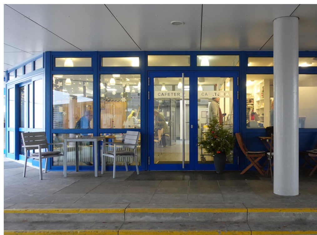
Abbildung 4: Die Cafeteria ist ein wichtiger Treffpunkt für die Nachbarschaft und bildet das Herz des Gesundheitszentrums.