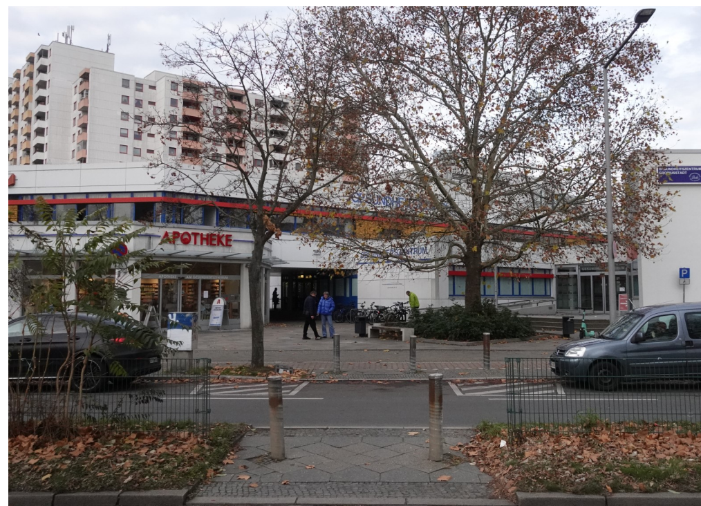
Abbildung 3: Der zweigeschossige Bau schafft einen Übergang zwischen den hohen Wohngebäuden und den niedrigen Einfamilienhäusern.

Abbildungen: 5 und 6 Das Gesundheitszentrum Gropiusstadt, vereint Ärzte, Psychologen, Physiotherapeuten, Sozialarbeiter, Krankenschwestern und Apothekerinnen an einem Ort. Es ist ein Vorbild für viele Gesundheitseinrichtungen in ganz Berlin.