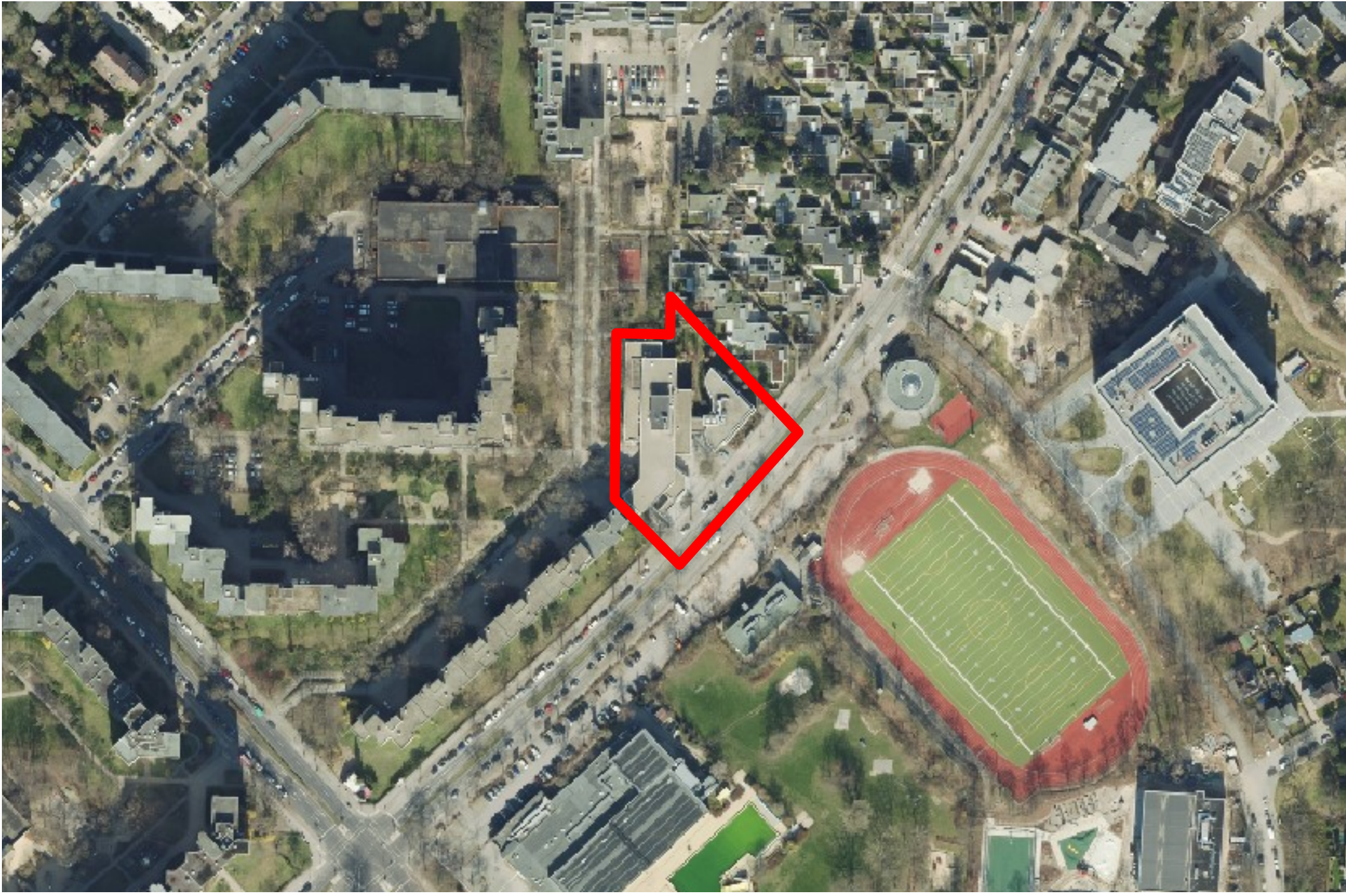
Abbildung 1 Luftbild

Frühzeitige Beteiligung der Öffentlichkeit gemäß § 3 Absatz 1 Baugesetzbuch