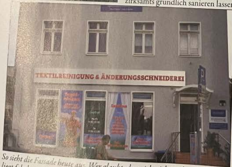
So sieht die Fassade heute aus. Wer glaubt, dass sich nicht viel verändert hat, liegt falsch – meint das Bezirksamt.

Topf der Buchhandlung Hella, Krokusstr. Rudow