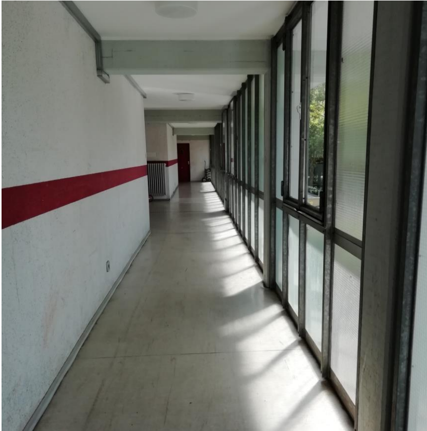
Verglasung Laubengang z.T Drahtgitterverglasung, durchlaufende Betonteile als Wärmebrücke