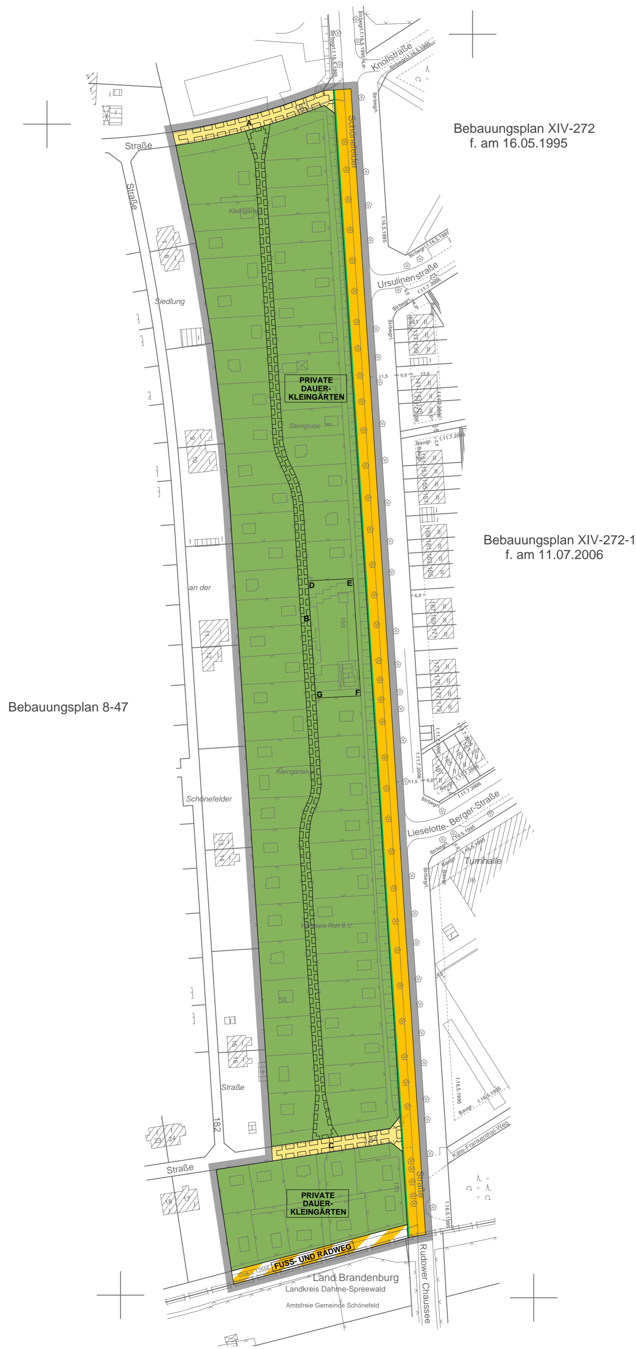
Bebauungsplan XIV-272 f. am 16.05.1995