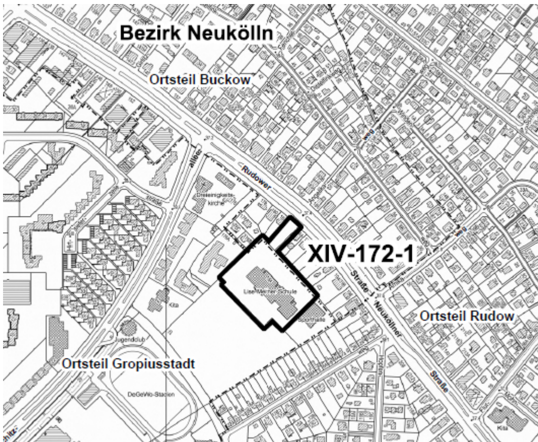
Übersichtskarte mit Geltungsbereich des Bebauungsplans XIV-172-1