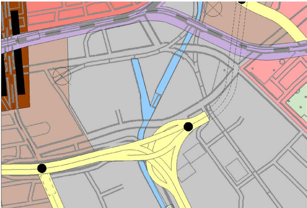
Abb. 2: Flächennutzungsplan von Berlin, Stand Neubekanntmachung 2015 (Ausschnitt), ohne Maßstab

Die südlich an das Plangebiet angrenzenden Flächen der Bundesautobahn A 100 sind als Autobahn mit Anschlussstelle an der Grenzallee dargestellt.