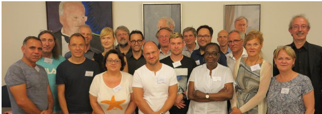
Foto 1: Mitglieder der AG „Leitlinien für gute Bürgerbeteiligung im Bezirk Mitte von Berlin“