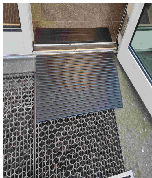
Mobile Rollrampen an den Eingängen der Ernst-Schering-Schule