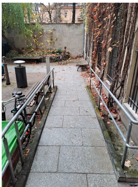
Auf dem Bild links ist der Zugang von den kleinen Pflastersteinen befreit. Rechts ist die neue, barrierefreie Bepflasterung des Zugangs zum Gebäude der Volkshochschule in der Linienstraße.