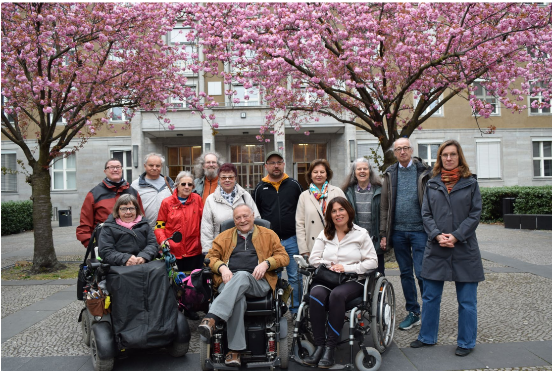
Beirat für Menschen mit Behinderungen im Bezirk Mitte

Der ehrenamtlich besetzte Beirat vertritt die Interessen von Menschen mit Behinderungen in Mitte und berät das Bezirksamt. Dabei arbeitet der Beirat mit dem Beauftragten für Menschen mit Behinderungen zusammen. Der Beirat kann Maßnahmen für mitte inklusiv vorschlagen, zum Beispiel die Übersetzung von bestimmten Dokumenten in Leichte Sprache. Der Beauftragte sendet die Vorschläge des Beirats an die Koordinierungsstelle.