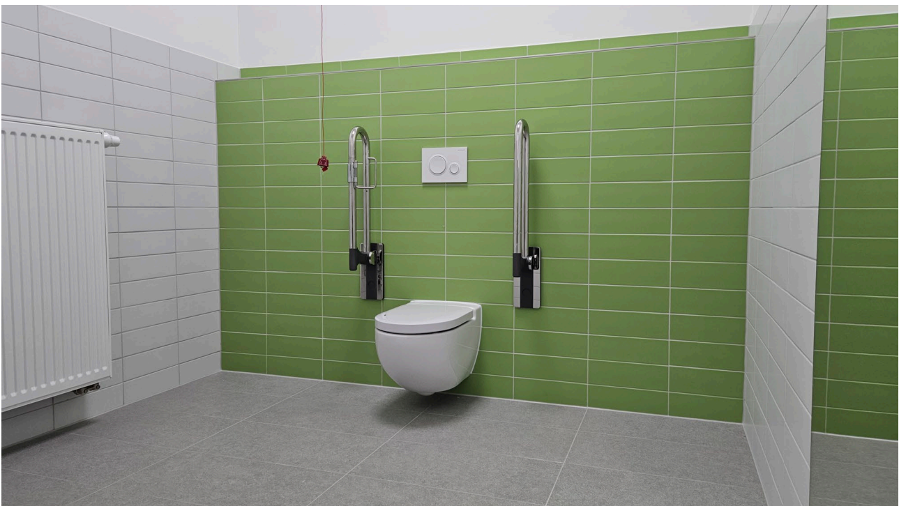
Der neue barrierefreie Sanitärbereich der Kita WirbelZwirbel, ©Ulrich Segerath, Biehler Architektur | PEHT GmbH

Ziel für 2025: Für die Kinder in der Kita WirbelZwirbel in der Tegeler Straße 13 entsteht ein barrierefreier Sanitärbereich. Dafür sind Umbauarbeiten sowie eine Neuordnung der Räume im Erdgeschoss und in Teilen des Kellers notwendig. Die Arbeiten sind Teil einer größeren Umbaumaßnahme, denn es ist auch die Sanierung der Vollküche geplant. Die Bauarbeiten werden durch den Träger Technische Jugendfreizeit- und Bildungsgesellschaft (tjfbg) GmbH umgesetzt. umgesetzt von: Jugendamt Kosten: 50.000 € Finanzierung: Bezirksmittel für Inklusion Ergebnis: Die Maßnahme wurde erfolgreich umgesetzt.