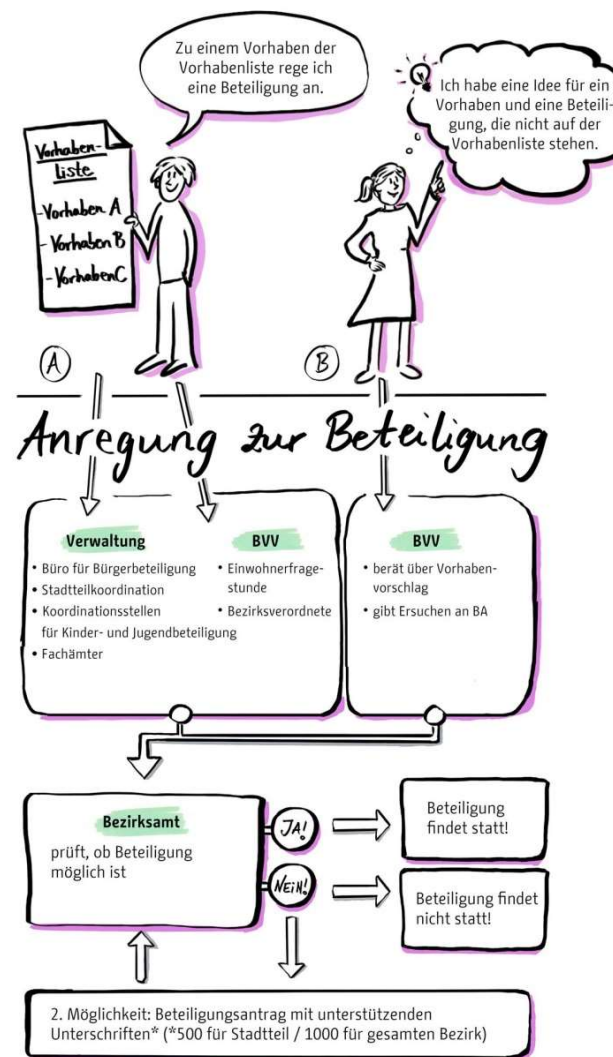
Abb.2: Schema zur Anregung von Bürgerbeteiligung

Ob ein Beteiligungsverfahren zu einem Vorhaben vorgesehen ist, kann aus den Projektsteckbriefen entnommen werden. Sollte es von dem Bezirksamt nicht vorgesehen sein eine Beteiligung durchzuführen, kann dies durch die Bürgerschaft angeregt werden. Auf welchen Wegen das möglich ist, verdeutlicht die nachstehende Grafik: