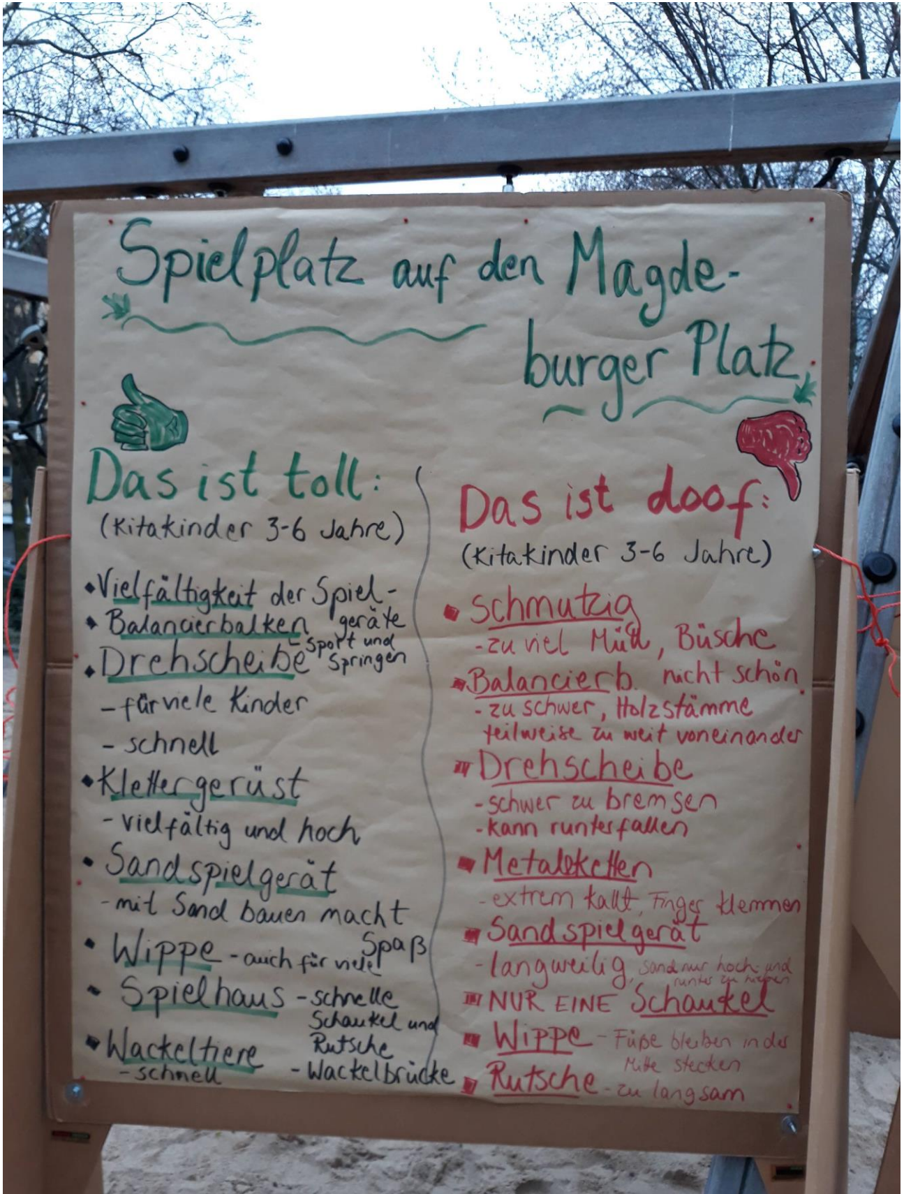
Zusammenfassung des Ist-Zustandes laut Kitagruppen, die bei der öffentlichen Veranstaltung am 29.03.2019 aufgestellt wurde.