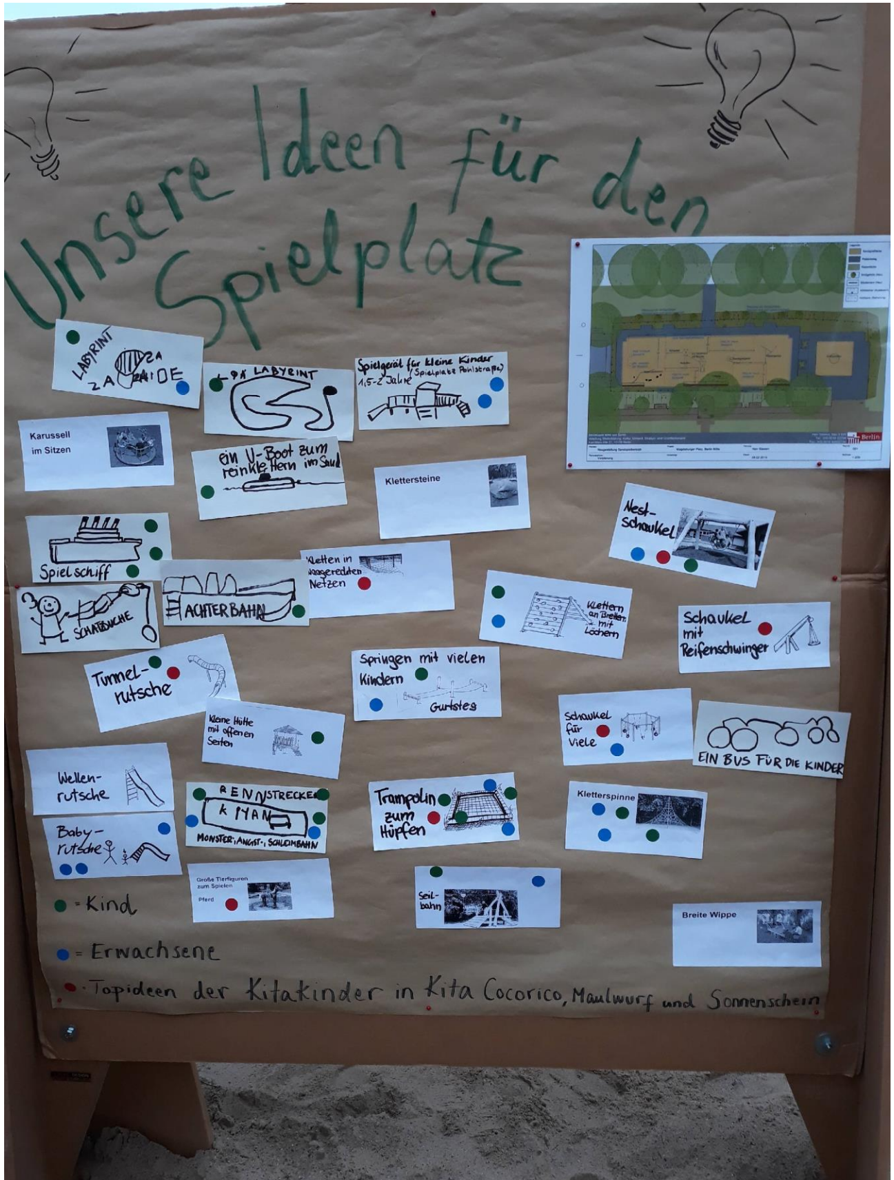
Ideenplakat mit Topideen der Kitagruppen bei der öffentlichen Veranstaltung am 29.03.2019.