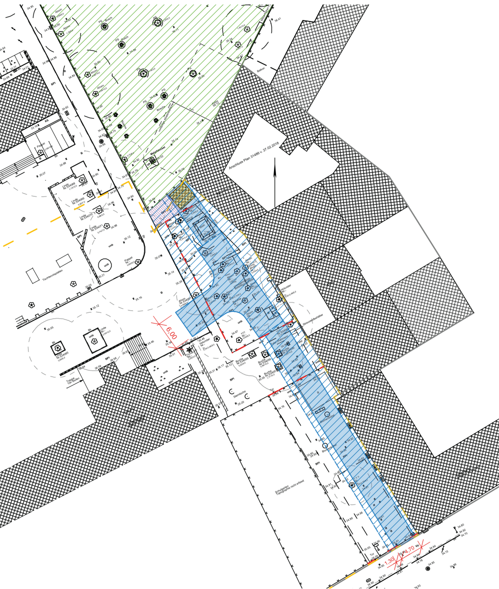
Prinzipkizze für Neubau südliche Erschließung über die Neue Jakobstraße