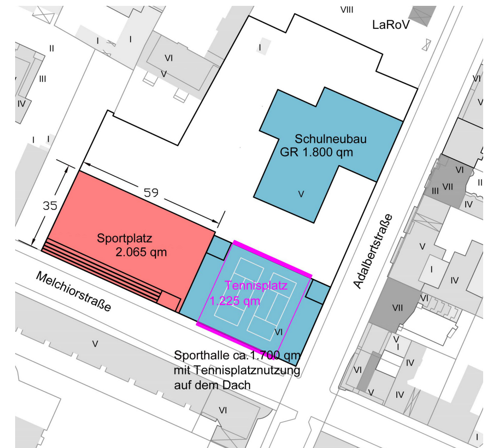
Variante 3 - Verlegung der Tennisflächen auf das Dach der Sporthalle (alle © S.T.E.R.N. GmbH, Grundlage: Senatsverwaltung für Stadtentwicklung und Wohnen Berlin, Abt. II / [MO2])