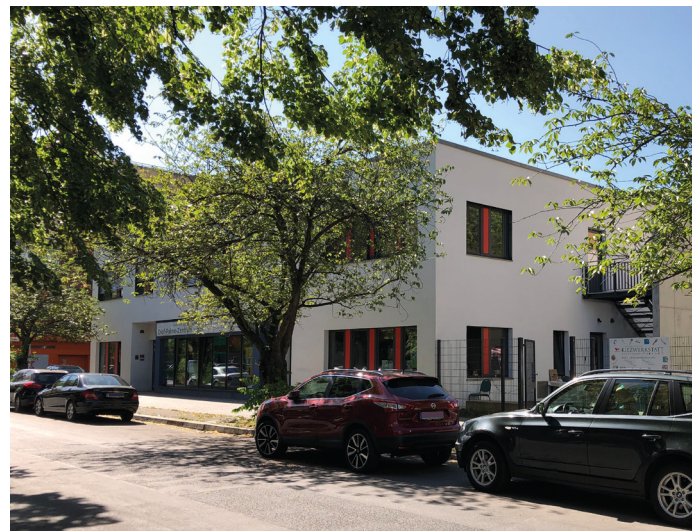
Beispiel für eine Mehrfachnutzung im Bestand - Das Olof-Palme-Zentrum © S.T.E.R.N GmbH

Ergebnisdarstellung zur Analyse der Mehrfachnutzungen im Bestand © S.T.E.R.N GmbH