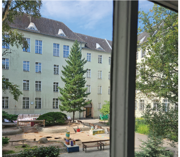
Begehung der Carl-Kraemer-Grundschule für die Fortschreibung der Raumdatei

Wir möchten uns bei Ihnen allen für die gute Zusammenarbeit bedanken und wünschen sonnige und erholsame Sommerferien.