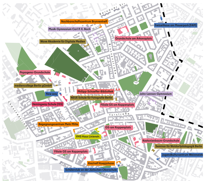
Erstellter Übersichtsplan im Rahmen der Raumabfrage für das J-Lennon-Gymnasium