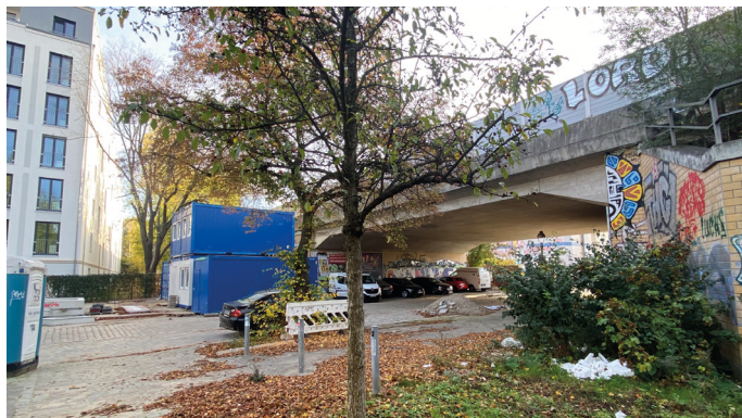
Unterführung Tegeler Straße

Da durch die Bebauung wichtige Grün- und Spielflächen reduziert werden, wurden ebenfalls Überlegungen zur Mehrfachnutzung der Außenspielfläche der Kita angestellt. Eine Kompensationsmöglichkeit stellt die öffentliche Nutzung der Tegeler Straße für Spiel und Freizeit dar. Durch den Bau der neuen S-Bahnlinie S21 bildet die Tegeler Straße zwischen Lynarstraße und Bahngelände eine Sackgasse. Hier wird die Umnutzung dieses Straßenbereichs geprüft. Bei der Variantenuntersuchung wurden die zahlreichen Bestandsleitungen im Boden berücksichtigt. Zudem muss der Zugang zum Bahngelände gewährleistet sein.